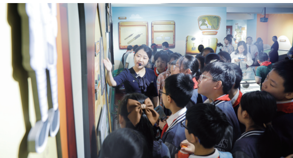
讲解员在为孩子们讲述地雷的故事

课堂”“雷震艺术作坊”等丰富多样的研学活动。互动有趣的展览、精心设计的研学手册、萌趣可爱的文创产品,拉近了革命文物与孩子们的距离,让孩子们在纪念馆了解革命文化,领悟革命精神。