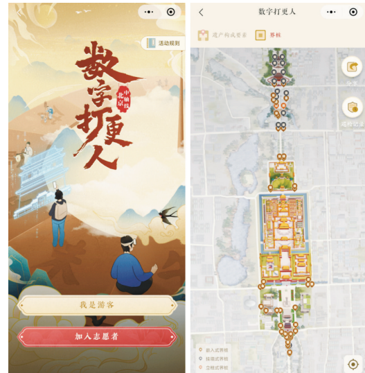
“数字打更人”小程序

为切实保障公众参与北京中轴线文化遗产保护的权益,进一步健全完善居民、社区和社会力量全民参与的遗产保护体系,北京创新推出全国首个公众参与文化遗产保护机制——《公众参与北京中轴线文化遗产保护与传承支持引导机制(试行)》,制定《北京中轴线文化遗产保护监督员管理办法(试行)》和《北京中轴线志愿者服务管理规定》,为激活积蓄在北京肌体内的文化动力撑起保护伞。