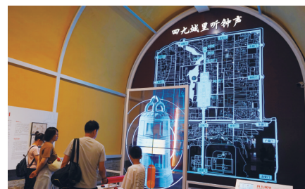
光影展示中轴线魅力