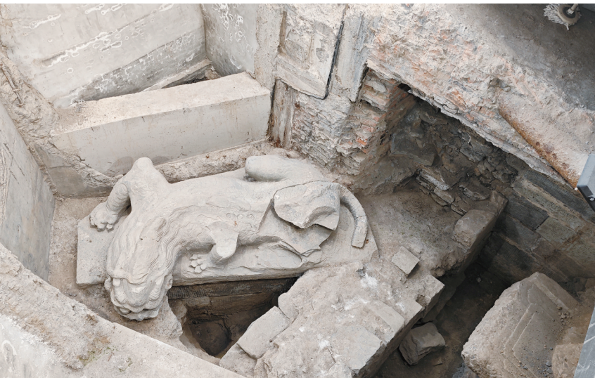
正阳桥考古遗址现场