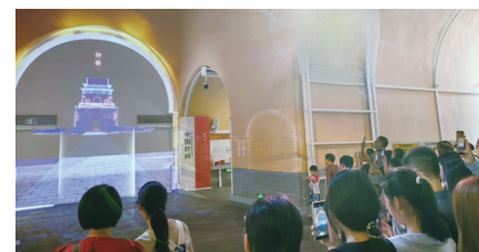
光影展示中轴线魅力

正统四年(1439年),修造京师门楼、城濠、桥闸,增修了瓮城、箭楼、左右闸楼,“深其濠,两涯悉甃以砖石,九门旧有木桥,今悉撤之,易以石”。据此可知,正阳桥石桥修建于正统年间,之前为木板桥。