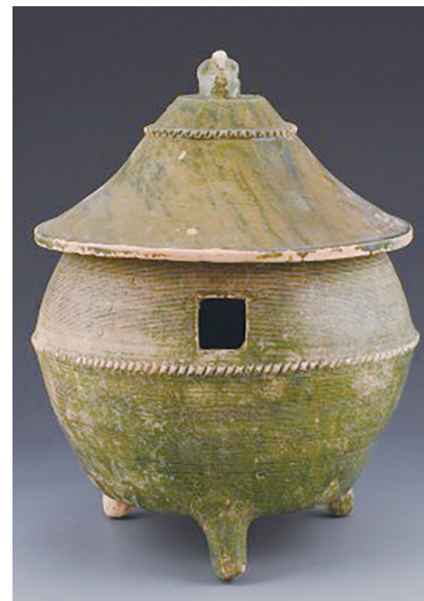
东汉绿釉陶仓(江西省博物馆藏)

近年来，作为文化传承的优良载体，文创产品的开发与设计得到国家、社会和大众的广泛重视，2014年国务院印发《关于推进文化创意和设计服务与相关产业融合发展的若干意见》，推动了文创产品消费需求的日益增长。文创产品设计对增强文化竞争力、提升国家文化软实力、推动经济发展方式转变等都具有积极作用。