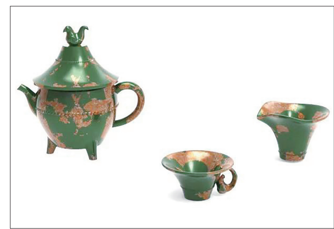
3D色彩效果图(作者设计)