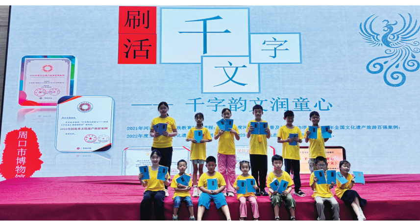
“刷活千字文”研学活动

近年来，河南周口市扎实做好“论证、保护、活化”三篇文章，持续推动文物系统性保护和科学性展示，形成了具有周口特色的文物工作实践样板。