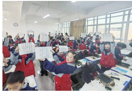
“刷活千字文”研学活动进课堂