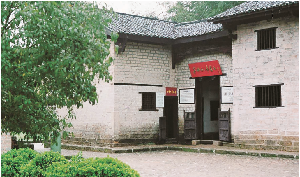
井冈山茅坪八角楼毛泽东旧居

吉安，井冈山革命根据地所在地。吉安是一块红色热土，全境为赣南原中央苏区范围，境内红色文化遗存丰富，经调查登记，不可移动革命文物近千处。