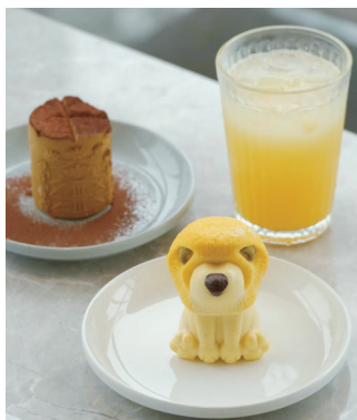
亚述之王特展文创:小狮子芒果慕斯