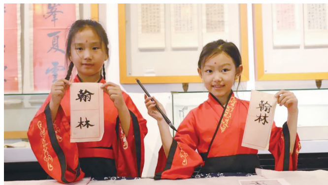
苏州状元博物馆“国学小课堂十岁成长礼”

博物馆之于苏州,是一本厚重的历史书。走进一座博物馆,仿佛翻开一页页史书。苏州博物馆藏吴王夫差剑精美完整、堪称国宝,让人不禁联想到古代诸侯争霸。苏州碑刻博物馆的“天、地、人、城”四大宋碑,是宋人智慧结晶和“科学精神”体现。苏州城墙博物馆,见证姑苏城两千多年的悠悠时光,探寻古城墙的今生与未来。中国苏州评弹博物馆馆藏的各类珍贵古籍,将四百多年的评弹艺术收录进了史册之中。苏州园林博物馆,充分运用“天人合一、因地制宜”的造园理