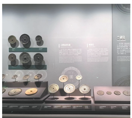
秦汉六朝隋唐——三吴都会