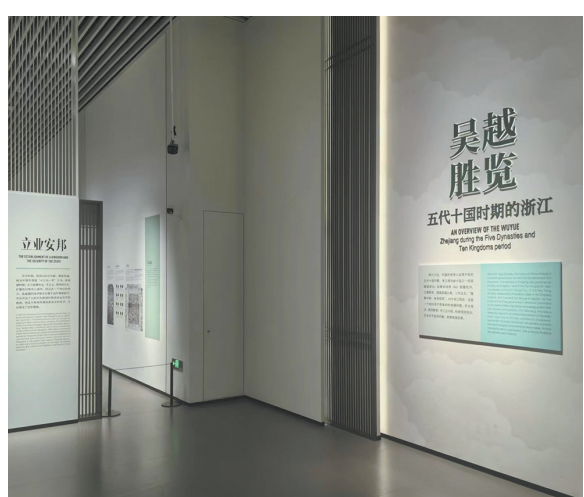
五代十国——吴越胜览