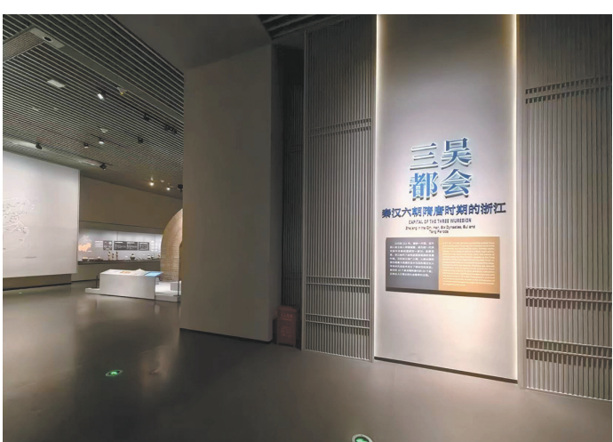
秦汉六朝隋唐——三吴都会