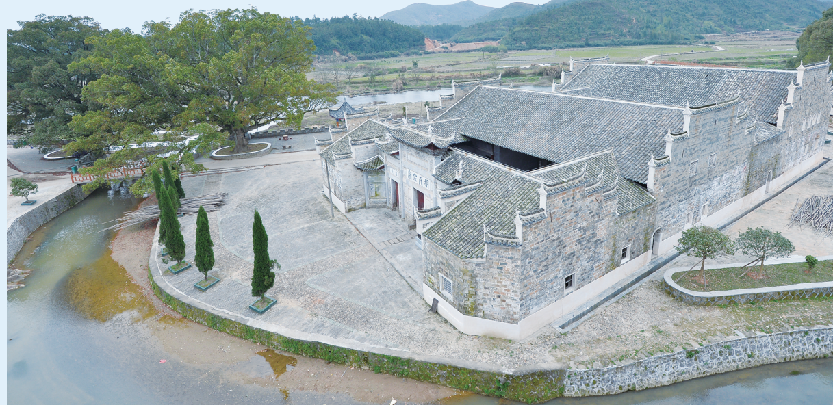
黄陂中共苏区中央局第一次扩大会议旧址

近年来，宁都县委、县政府坚持深入贯彻落实习近平总书记关于革命文物工作的系列重要论述和重要指示批示精神，按照“保护第一、加强管理、挖掘价值、有效利用、让文物活起来”的文物工作要求，积极推进革命文物保护利用工作，在保护好、管理好、利用好革命文物工作中做出了有益探索和尝试，取得了可喜的成绩。如今，在这块红土地上，一处处革命旧址、一条条苏区标语，一件件红色文物……见证了宁都县扎实推进革命文物保护利用，让革命文物以其独特的方式，诉说党和人民英勇奋斗的光荣历史。