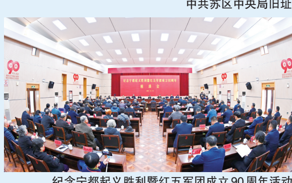
纪念宁都起义胜利暨红五军团成立90周年活动