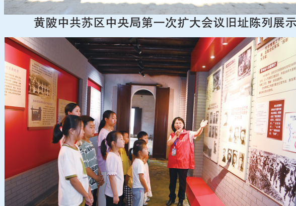
文明实践员在革命旧址内开展“讲红色故事”活动