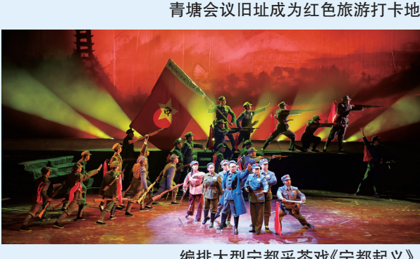
编排大型宁都采茶戏《宁都起义》