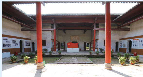
黄陂中共苏区中央局第一次扩大会议旧址陈列展示