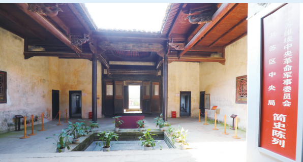
中共苏区中央局旧址陈列展示