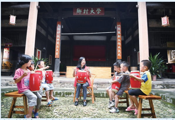
小源村革命旧址成为新时代文明实践站，开展文明实践教育活动