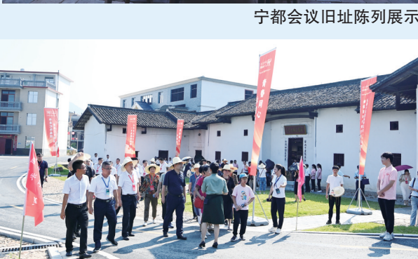
青塘会议旧址成为红色旅游打卡地