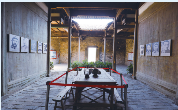
宁都会议旧址陈列展示