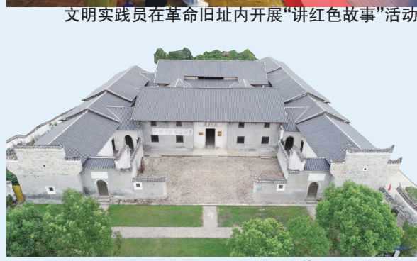
中共苏区中央局旧址