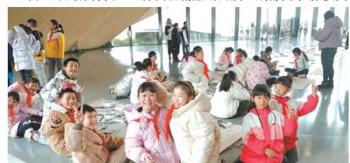
160位小朋友共绘水墨长卷

与文物对话，体味人民艺术家的孜孜以求。“白云深处作神仙——齐白石精品研究展”是成都市美术馆继黄宾虹、关山月等国画大师作品展之后，聚焦近现代国画家蜀现象的“再读大师”系列展览。该展览特别梳理了齐白石与巴蜀地区的深厚情缘，共展出136件齐白石真迹