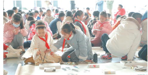
160位小朋友共绘水墨长卷

精品，包括齐白石游历成都时期的书画作品、“吾道西行”的篆刻、全程报道白石入蜀行程的《新新新闻》报纸、以及国宝级文物《四季山水屏》等珍贵展品。