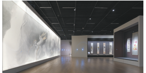
“白云深处作神仙——齐白石精品研究展”

齐白石是20世纪最具影响力和创造力的中国画家之一，他的艺术足迹横跨清末、民国和新中国三个历史时期，出生农民家庭却在“不教一日闲过”的勤奋努力下成长为一代画坛顶流，被誉为“人民的艺术家”。