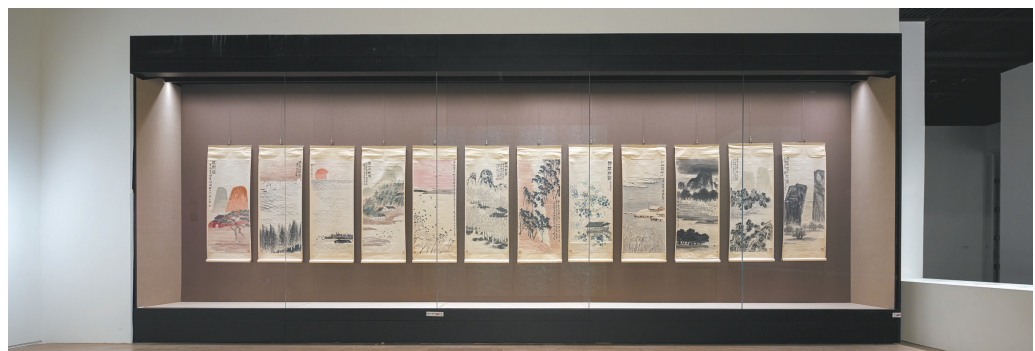
“白云深处作神仙——齐白石精品研究展”