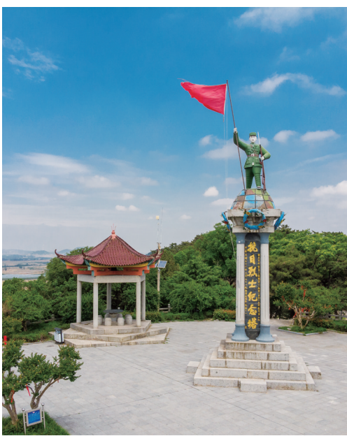
抗日烈士陵园(江苏连云港)

家文化公园、区域协调发展等重要战略融合发展,充分发挥革命文物在经济社会发展中的重要作用,将红色基因融入社会、经济、民生发展,推动革命文物保护利用成为地方经济发展亮点。