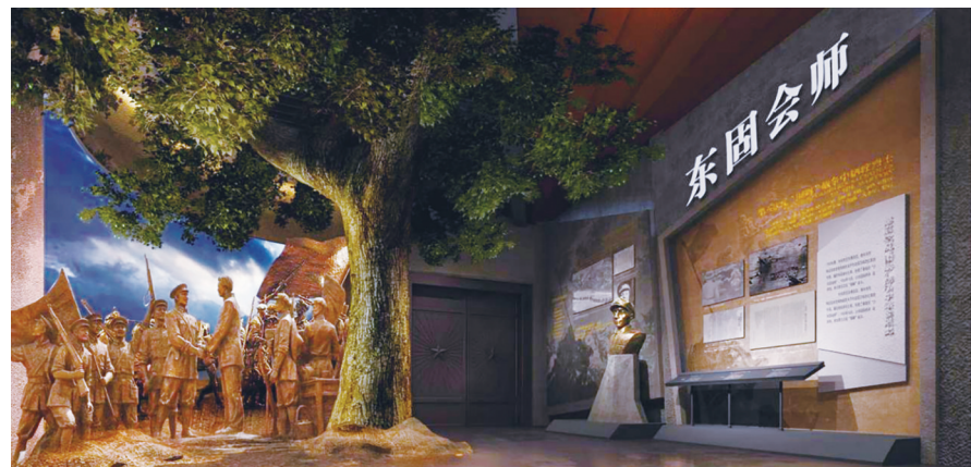
东固革命根据地纪念馆基本陈列

区域之公开割据政策,而采取变定不居的游击政策(“打圈子”政策),以对敌人的跟踪穷追政策”。这实际上就是后来名扬中外的“游击战争十六诀”的雏形。