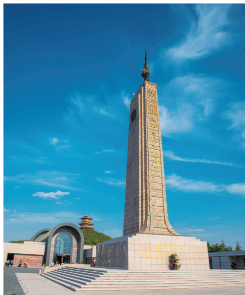
铁道游击队纪念馆(山东枣庄)

《规划》具有四个特点。一是全面摸清家底。历时一年组织开展了新中国成立以来,山东首次全省性、系统性的不可移动革命文物调查工作,全面摸清摸准了全省不可移动革命文物资源底数和保存现状。在试点调查的基础上,探索制定了调查标准、技术路线,通过查阅资料、访谈、记录、拍照、测量、航拍等技术手段展开实地调查,获得翔实、全面、准确的调查资料,为规划编制打下了较为坚实的基础。二是全面梳理史实。聚焦山东片区抗日战争时期的革命史实,分析了山东抗日根据地经历的开辟初创、巩固发展、艰苦斗争、实施反攻四个阶段的革命历史,总结出“巩固华北,发展华中”战略落实地,全民抗战集中体现地,抗日战争重要支撑保障地,向北发展、向南防御战略枢纽地,沂蒙精神核心发源地,抗战文化集中传播地六大片区主题。在深入研究山东片区革命事件及演变过程的基础上提出“五片规划分区”“七个重点县”“八条革命文化线路”“多个标识点”构成的总体空间布局。三是突出连片保护与整体展示。以山东片区范围内具有代表性的重大事件和会议遗址、重大机构旧址、重要人物旧居为重点,科学研究预防性保护、文物本体修缮、保存环境治理、数字化保护等连片保护项目和革命文化主题游径、展示水平提升、发挥综合服务功能等整体展示项目。四是强化融合发展。紧密对接国家战略和地方经济社会发展规划,立足相关资源禀赋及区位优势,统筹提出“革命文物+”的实施路径和方法,推动片区建设与乡村振兴、国