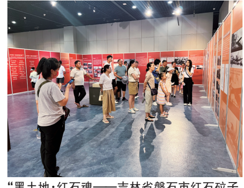
“黑土地·红石魂——吉林省磐石市红石砬子抗日根据地的创建与风云历程”展在延安革命纪念馆巡展