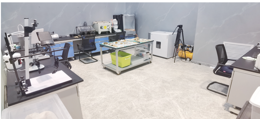
可参观考古工作站

色展示系统,增强了遗址的可读性,成为磐石红色旅游打卡地。遗址由公众考古小组引导、讲解,红色教育成果突出,省内各机关、企事业单位、高校、党校等团体相继前往遗址进行参观学习,日流量最大可达千人。