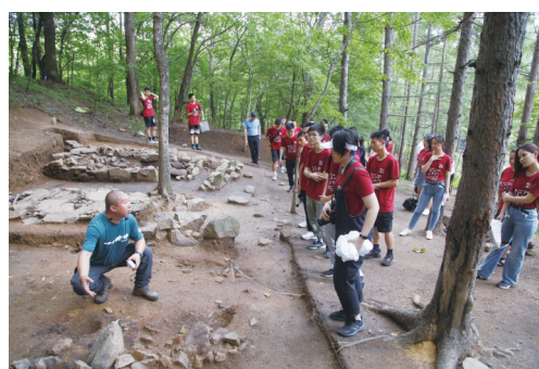
研学参观(中学研学团)