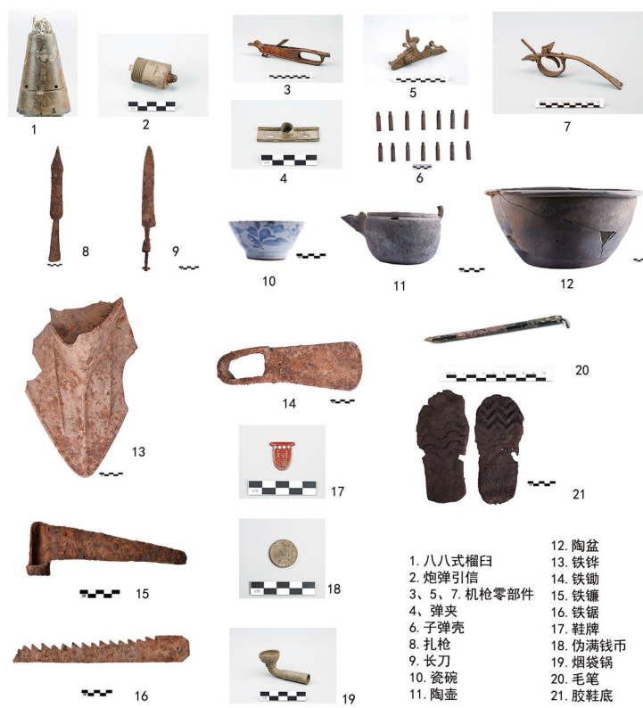
红石砬子遗址出土部分遗物