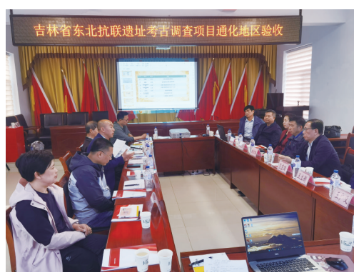
东北抗联遗址调查验收会

由于抗联相关遗迹大部分暴露地表,因此在严格按照田野考古操作规程开展发掘工作基础上,采用10米×10米规格布探方,实施平面整体揭露,以保证遗迹完整性。对于地窖子的发掘采取了二分法发掘,按遗迹单位进行遗迹采集、整理工作。通过详细完备的工作方案和切实可行的