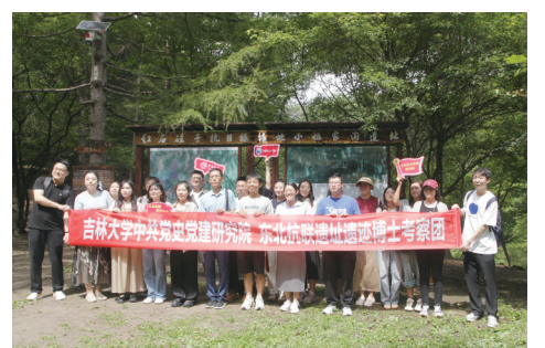
研学参观(博士考察团)