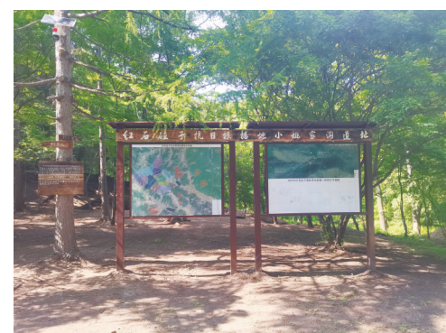
红石砬子遗址展板介绍

吉林省为建立和完善东北抗联遗址清单,进一步构建东北抗联遗址保护利用格局,在国家文化遗产保护专项资金的支持下,于2021年启动东北抗联遗址考古调查项目,对东北抗联遗址分布密集的吉林市、通化市、白山市、延边朝鲜族自治州四地实施全面考古调查。截至目前,吉林市、通化市完成调查面积2000多平方公里,完成了登记在册的14处抗联遗址调查,遗址内新发现遗迹点位2.5万余处,点位类型涵盖居住址、警戒地、会议址、营训地等多种类型,初步建立了吉林、通化两地东北抗联遗址数据库。目前白山市、延边朝鲜族自治州的东北抗联遗址考古调查已经完成部署工作,预计2026年完成调查。