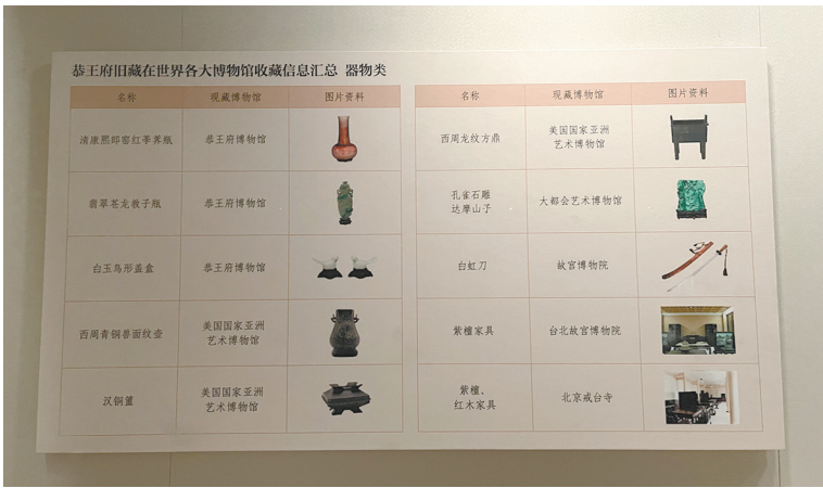
恭王府器物类旧藏疏散信息

骏马自知前程远,不待扬鞭自奋蹄。中国博物馆走过的一个个金色足迹,将成为高质量发展道路上的攀登阶梯,也必将汇聚为中华民族伟大复兴征程上生机勃勃的“博物馆力量”。