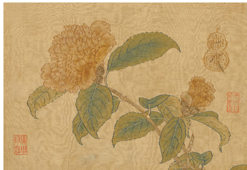
宋缂丝赵信木槿花卉图册页