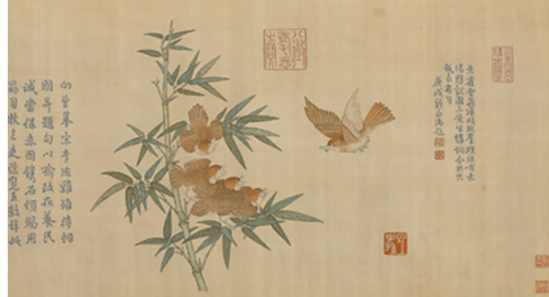
清缂丝鹤雏待饲图卷