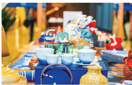
“微笑计划”文创产品展台

中国文物学会文化创意发展委员会主任委员杨晓波认为：“我们所从事的工作，是将文化自信的种子通过公益事业进行播撒，是让越来越多社会资源、社会力量关心、关注文物事业的高质量发展，关注文化创意产业创造性转化、创新性发展，更是满足大众文化需求，为人民美好生活提供服务，彰显了中华文化的博大精深与人文关怀。”