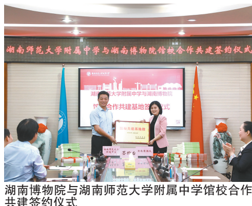
湖南博物院与湖南师范大学附属中学馆校合作共建签约仪式