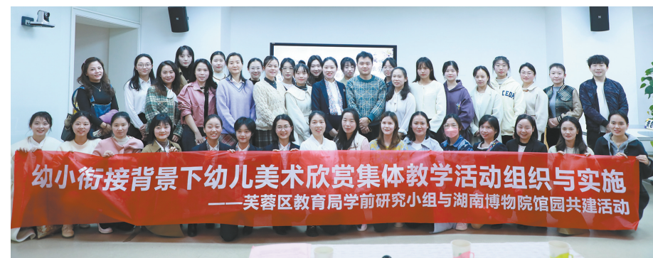
湖南博物院与芙蓉区教育局学前研究小组馆园共建活动