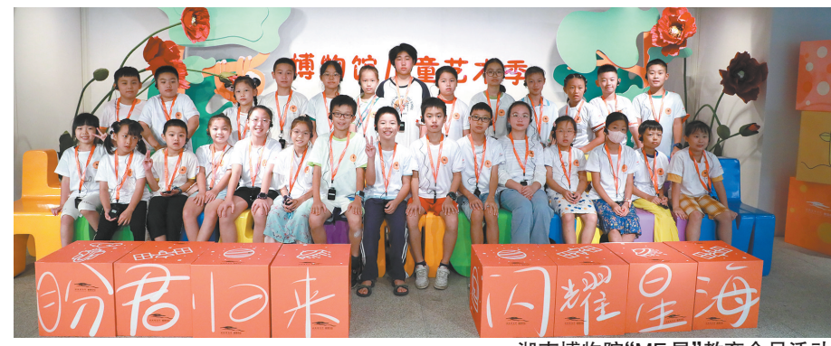
湖南博物院“ME星”教育会员活动