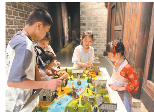
“博物馆探索车”项目——“湖南人”展厅现场活动体验