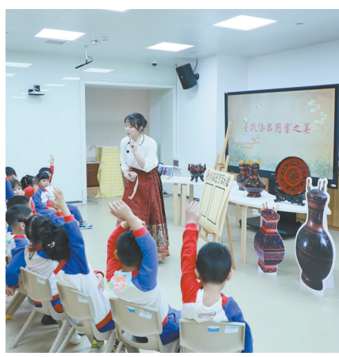
万国城幼儿园在湖南博物院开展教育活动