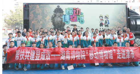
湖南博物院“移动博物馆”走进津市市德雅中学