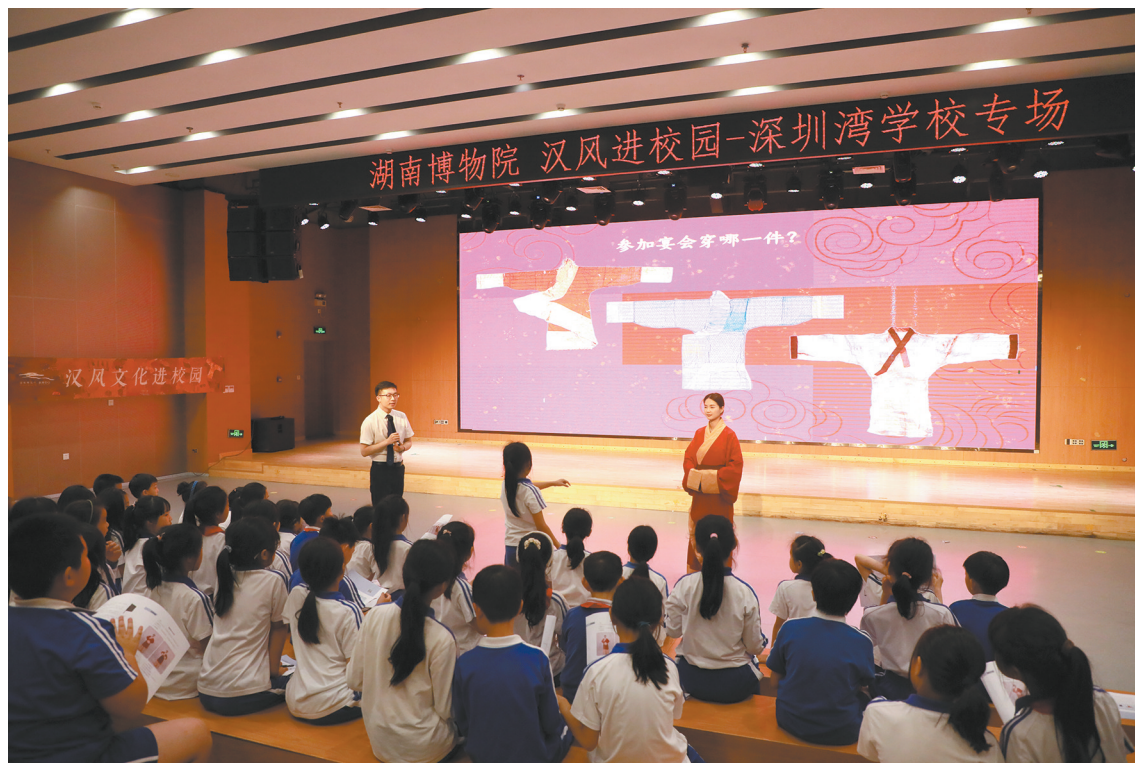
教育员赴深圳各学校开展汉风示范课程

以学识背景分众为例:面向学龄前和小学学段的受众,考虑到受众的学识水平还处在启蒙或初级阶段,我们采用引导启发式教学,重视学生自主意识的培养和概念的形成,比如“汉风文化进校园”示范项目、寻访湘湖——湘博艺术研学课程;对于初、高中学段的受众,我们采用合作讨论式的教学方式,鼓励他们在交流过程中交流互助,增强合作意识;而面对自主思考能力和知识水平更高的大学及以上学段受众,我们主要采用提问式和延伸探索式的教学方式,鼓励参与者构筑专业知识体系。在此基础上,我们还着重考虑了各学段参与者的兴趣和体验方式,以提升活动参与者与内容形式的同频度。