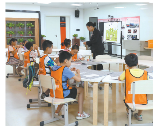
“我的假日在湘博”教育活动