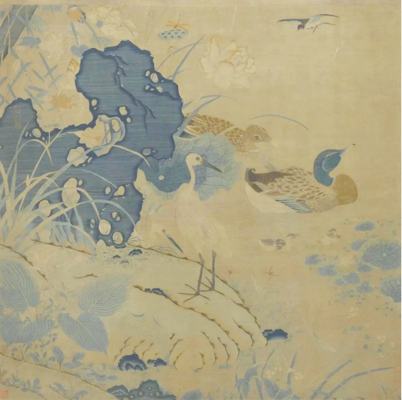
朱克柔 缂丝《莲塘乳鸭图》南宋 上海博物馆藏

中缂丝的质量与数量大幅提升。明代晚期，手工艺品的商业化趋势日益显著，这一现象逐渐渗透至缂丝行业。经济利益的驱动，如同一股不可抗拒的潮流，促使缂丝作品数量激增。