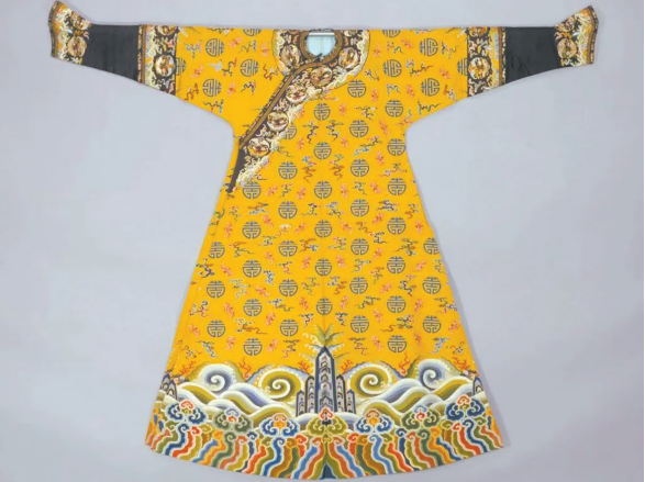
《黄色缂丝云蝠寿袍》清乾隆