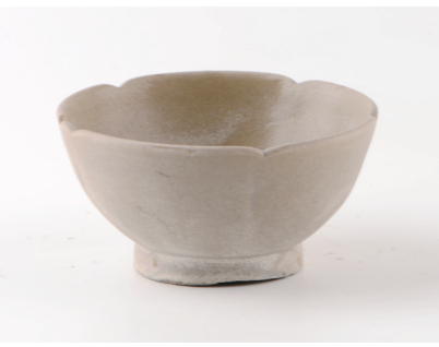
唐五代时期花口瓷碗

据介绍，商周时期遗迹以灰坑为主，还有1座墓葬。遗迹以印纹硬陶和原始青瓷为主。印纹硬陶以陶罐为大宗，基本囊括同时期长江中下游地区的硬陶纹饰类型；原始青瓷以瓷碗、瓷杯为大宗，总体烧制技术已经比较成熟。