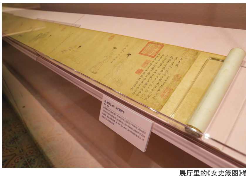
展厅里的《女史箴图》卷

在展示手法上，除了文物陈列和传统图文展板，还引用了多媒体展示和光影创意装置。《七夕乞巧》动画视频以古