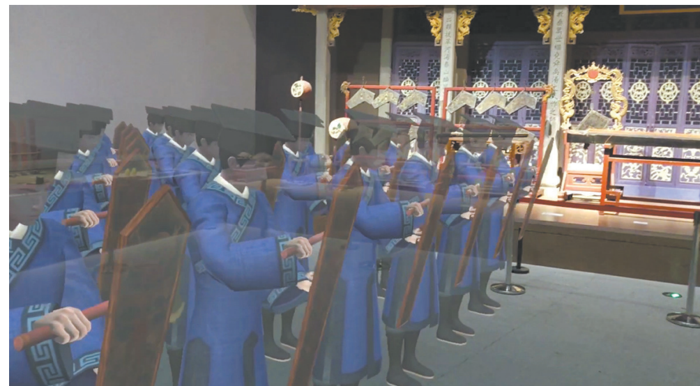
“听·见湖湘——湖南音乐文物与故事”展览浏阳古乐部分MR体验

此外，践行“以公众为中心”的思路，推行前置性、形成性和总结性评估，并将调查数据和结果运用于陈列展览的具体策划与实施中，推行巡展的“在地化”和“区域化”策展理念，实施“分众化”的教育和营销策略卓有成效。同时，不断思索引进展览如何避开“千馆一面”“千展一面”，着力从内容与艺术设计的高度统一入手，守正创新，结合定位量身定制博物馆的高品质展陈。比如基于对展览主题的理解，从设计的角度去形成新的展陈语境。通过对“法老·诸神·木乃伊——古埃及文物特展”的展陈语境分析，在内容和展品基本统一的情况下，湖南博物院的展陈艺术设计是原创的；通过对“来自阿富汗的国宝”展的内容理解，设计立足主题与形式的结合，同时拓展对其地理位置、基本国情以及早期历史的展示，以求给予观众更为全面的背景知识，从而理解展览重新策划所凝练出的主题及其意义。