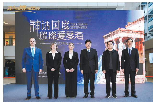
“神话国度 璀璨爱琴海——古希腊文明史诗”展览开幕式

项原创性展览和多类核心收藏，引发广泛关注，比如赴韩国、美国举办“齐白石艺术珍品展”，赴意大利举办“马王堆汉墓珍品展”等。