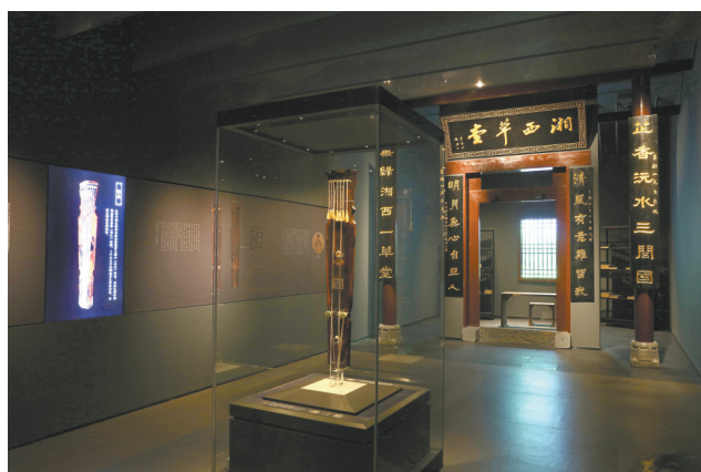
专题陈列“激逸响于湘江兮——潇湘古琴文化展”场景

在博物馆展陈策划和实践中，形成了一些好用的模型和方法。比如“深描”原是文化人类学的一个经典概念，被引入到博物馆展陈中去阐释以“文物”为代表的展品及其组合。2019年5月18日，举办了“根·魂——中华文明物语”展览，仅用30件（套）展品勾勒出中华文明的发展历程及所取得的成就，奉献给观众一个以经典文物为叙事主体的“极简文明史”，以“一物一围合，一件一叙事”的新型展示方式，将文物置于立体的时空中，并通过多维度解读每一件文物，让观众欣赏经典文物