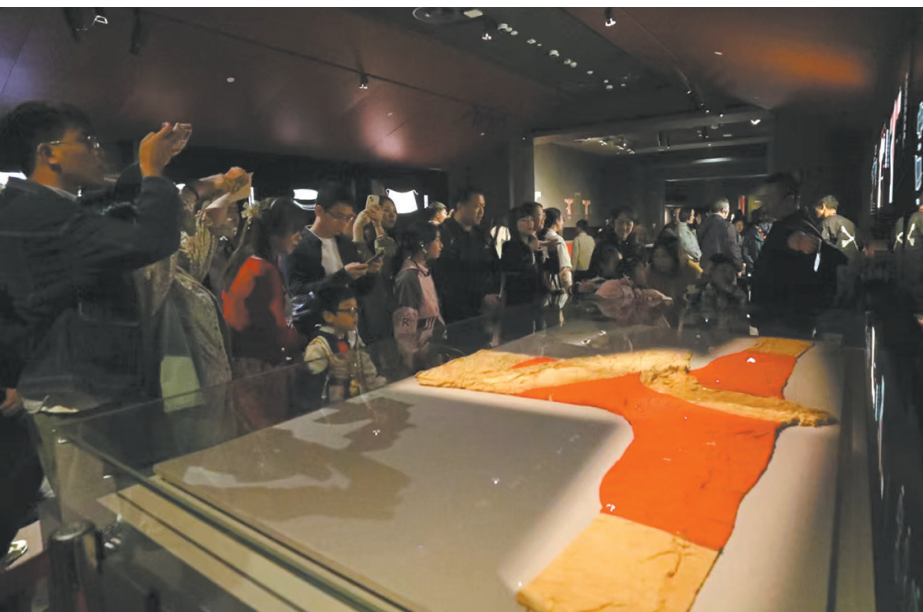
观众参观“长沙马王堆汉墓陈列”

100余个，为发展社会主义先进文化、弘扬革命文化、传承中华优秀传统文化、铸牢中华民族共同体意识与建设中华民族现代文明发挥了重要作用。其中，基本陈列“湖南人——三湘历史文化陈列”和“长沙马王堆汉墓陈列”，获评第十六届（2018年度）全国博物馆十大陈列展览精品奖；先后举办了“激逸响于湘江兮——潇湘古琴文化展”“画吾自画——馆藏齐白石绘画作品展”“瓷之画——从长沙窑到醴陵窑”“齐家——明清以来人物画中的家族生活与信仰”“烟云尽态——湖南省博物馆藏《三希堂石渠宝笈法帖》展”“王门艺事——王闿运和他的弟子们”“至纯至美——湖南省博物馆藏单色釉瓷器展”“方圆之境——湖南省博物馆藏铜镜展”“扇里扇外——湖南省博物馆藏扇面展”“亘古的祈愿——梅山文化圈雕塑与信仰”等专题陈列；特别展览新馆首展分别为“东方既白——春秋战国文物大联展”和“在最遥远的地方寻找故乡——13-16世纪中国与意大利的跨文化交流”，展示出新湘博对临展布局的战略规划，既关注东西方的历史文化发展进程，又重视东西方文明之间的交流与互鉴，是新湘博特别展览形成不同系列的雏形，之后湘博逐渐塑造了中国古代文明系列、世界古代文明系列、中国艺术系列、世界艺术系列和湖湘区域文明系列等诸多特展类型。