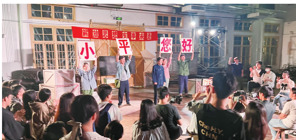
“启航·春天的故事”沉浸式实景互动剧场

地、江西省国防教育基地、江西省干部党性教育现场教学示范点、江西省中小学生研学实践教育基地、江西省工业遗产旅游基地等，已经成为开展爱国主义教育、传承红色基因、弘扬革命文化的重要平台。