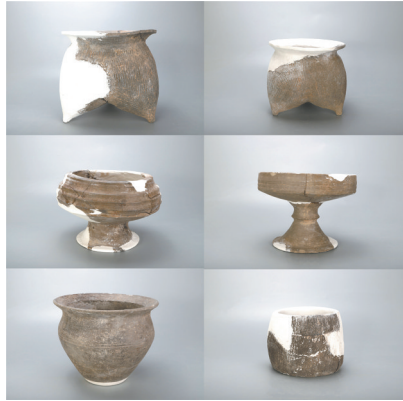
出土陶器、陶簋、陶豆、陶孟和陶钵

身份等级较高，可能为制陶生产的管理者。在J5和Y19填土堆积内均出土一具人骨，根据发掘情况看，应是在水井和陶窑废弃后埋入的。M34无葬具，仅挖一个小坑，将人埋入后，用1件夹砂褐陶疙疙瘩瘩打碎覆盖在上面。这些人骨很可能是专门从事制陶的底层陶工，死后随意扔进废弃后的陶窑和水井中或简单处理后埋葬。这为我们研究制陶生产组织管理提供了重要证据。