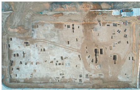
东梁王一村遗址2022年度发掘全景(上为北)

砖室墓(M20) 整体平面形状近“刀”形，由墓道、墓门、墓室组成，形制简单，似为一带墓道的砖椁墓。墓道向南，直壁，底为台阶斜坡式。墓门外残存侧立纵砌封门墙。铺地侧立砖对缝纵砌；墓壁仅存北壁，基本为顺向对缝平砌。因破坏严重，未见葬具。墓门内外填土中分别发现1头骨和若干肢骨。随葬品有陶壶3、大泉五十铜钱1、铜镜1，位于墓门内侧填土中。