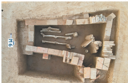
唐代砖椁墓M6(上为北)