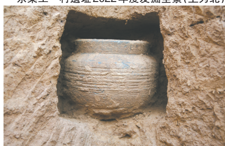
战国土坑竖穴墓M25出土陶罐