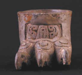
祭祀用豹爪形陶杯 古典时期(公元200年至900年) 萨波特克文化 卡洛斯·斐里瑟·卡拉玛人类学 博物馆藏