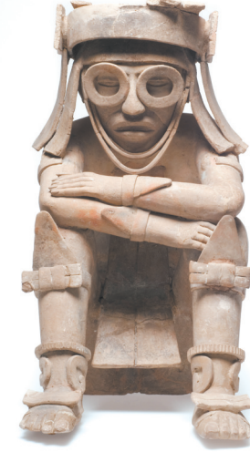
雨神特拉洛克陶像 古典时期晚期 (公元600年至900年) 韦拉克鲁斯中部文化 哈拉帕人类学博物馆藏