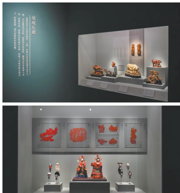
“格物匠心——福建传统工艺展”中“艺蕴百态”单元

策展组通过对材料的梳理与研究,总结出福建地域文化的外延在工艺美术作品中的具体体现,如建筑空间与当地生活的关系、传统工艺的选材特色、传统艺术风格的独特表现、民间信仰的丰富题材,以及对外交流的重要因素等。策展组将地域文化与展品之间的关系作为不同专题,应用于展览叙事结构之中。其中,以“艺蕴百态”单元为例,该部分以福建多种多样的传统工艺形式为媒介,