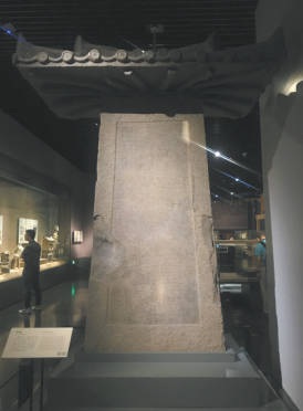
裴君碑 东汉(25年至220年) 成都东御街出土