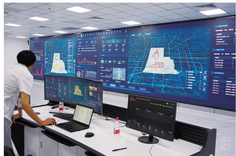
北京中轴线文化遗产监测与保护平台