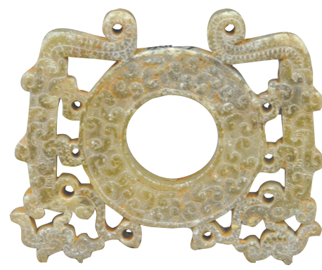
双龙形玉璧 洛阳博物馆藏