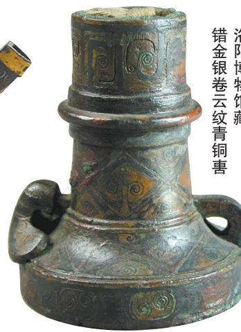
错金银卷云纹青铜罍 洛阳博物馆藏