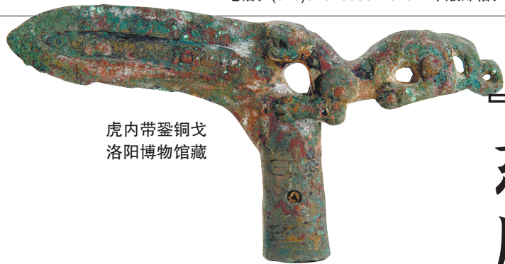
虎内带盃铜戈 洛阳博物馆藏

2024年7月27日，“东周时期的洛阳与苏州”特展将在苏州博物馆本馆正式向公众开放。作为继“天下惟宁：汉代文明的四张面孔”之后，苏州博物馆推出的“中国古代文明”系列的第二展，此次特展聚焦革故鼎新的东周时期，依托洛阳与苏州两地历年考古发现与最新研究成果，精心遴选200余件(套)文物，通过“踏墟寻城”“朝周问礼”“兴兵征伐”“万殊归一”四大主题，系统梳理中原与吴地之间互动共生的发展脉络，再现中华文明多元一体格局演进的历史进程，帮助社会公众在观展中进一步了解和把握中华文明的突出特性。