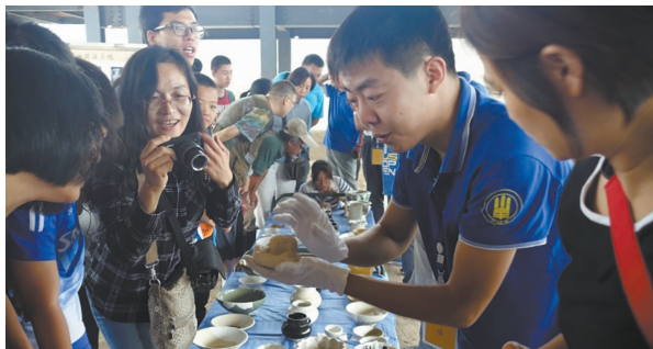
“河博之旅”第二期走进正定开元寺南广场遗址,听考古人员现场讲解