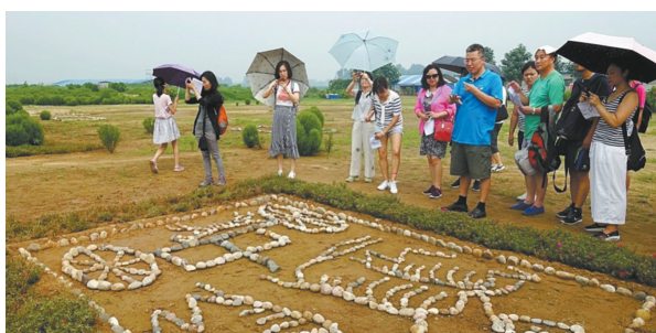
“河博之旅”第一期走进进行唐故郡遗址

博物馆组织游学活动,不仅仅是向公众展示考古发现的过程,更是传播文化遗产知识、普及保护理念的重要途径之一。当前,文化遗产保护面临着多重挑战。一方面,自然侵蚀、城市化进程加快、战争与冲突等因素对文化遗产造成了不可逆转的损害;另一方面,公众对文化遗产价值的认识不够,保护意识不足,也给文化遗产保护增添了诸多不利因素。博物馆组织的游学活动,使公众能够近距离接触和了解考古发现,从而加深对文化遗产的认知。这种直观的体验方式,比传统的书本知识更加生动和有效。通过沉浸式的参与体验,不但可以将复杂的考古知识和保护技术以通俗易懂的方式传授给公众,也能使他们通过目见