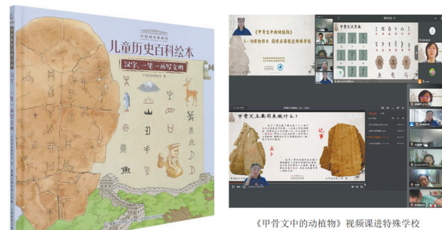
《甲骨文中的动植物》视频课选录清华大学

甲骨文系列实践课程是国家博物馆社教部古文字项目组依托甲骨文等古文字方面的馆藏文物和学术资源,在策划实施相关教育活动、教材研发、科普读物撰写、科普视频制作等