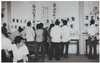
学员们观看习作作品展