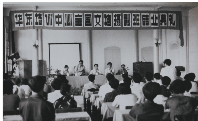
华东文物摄影培训班结业仪式

授;“摄影诞生与演变”由摄影家盛继润讲授;“摄影与编辑”由文物出版社编审沈百昌讲授;“文物与旅游摄影”由中国旅游出版社编审张冠嵘讲授;“名胜古迹摄影”由摄影家协会理事蒙紫讲授,柯达公司技术部介绍最新中型“金刚石”彩色多功能自动冲洗设备并进行实际操作表演,教学内容更加丰富多彩。