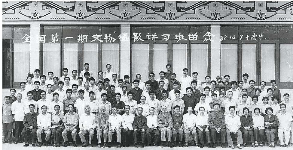
1982年广西文物摄影培训班开学合影