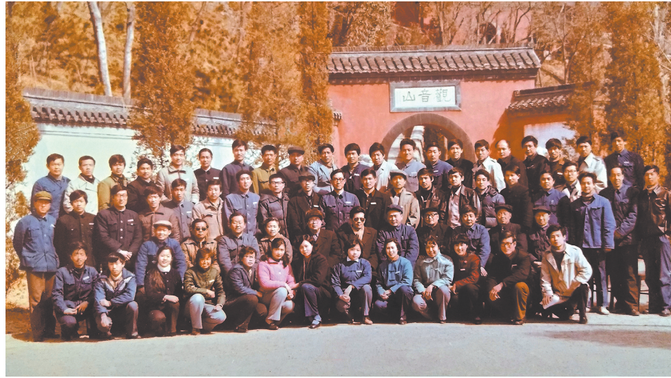
1983年华东文物摄影培训班开学合影

二十世纪七十年代,山东省雀山汉墓出土孔子、孙臧兵法竹筒,湖南省马王堆汉墓、湖北省擂鼓墩曾侯乙墓、河北省满城汉墓等考古遗址出土了大量珍贵文物,在国家文物局组织下进行了保护性发掘,考古发掘现场都安排有摄影工作者实时记录,留下一批对文物保护、整理、修复和研究具有重要意义的影像资料。