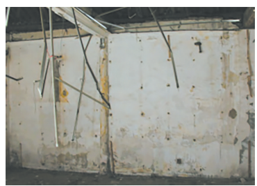
铲除室内水泥抹灰面层