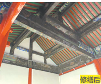
恢复府门上架净满地仗

进行此次项目修缮的北京城建园林北京市园林古建工程有限公司(以下简称“公司”)是国内较早的国有园林古建施工单位之一，成立于1952年，原隶属于北京市园林局，现为北京城建集团下属国有全资子公司，是集施工总承包、古建修缮、园林绿化、仿古工程、市政工程、装饰工程、勘察设计运行于一体的园林古建综合服务商和中国传统园林古建文化的传播者。