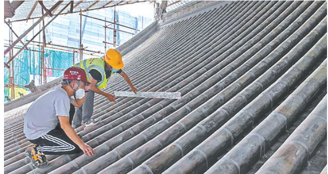
检验瓦面修缮效果