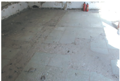
揭露室内水磨石地面