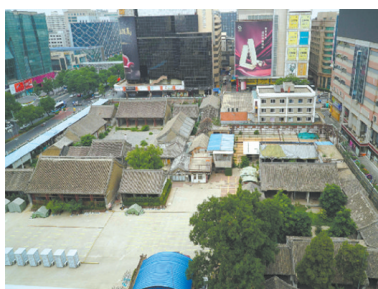
文物建筑群修复前