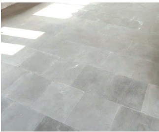
恢复古建方砖细地地面