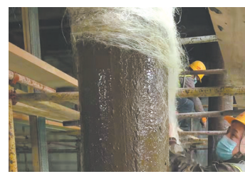
麻五灰古建传统地仗恢复过程