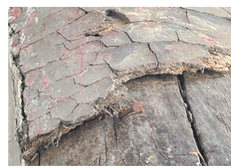
麻五灰古建传统地仗恢复前