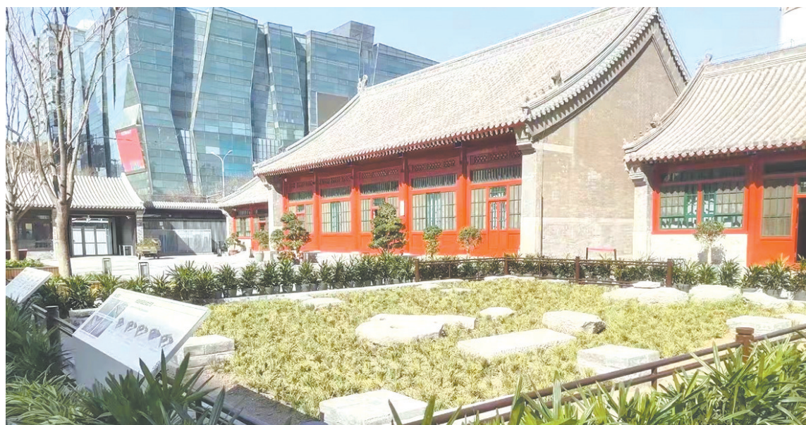
原东厢房遗址展示