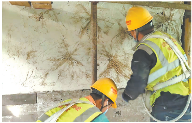
恢复传统抹灰做法