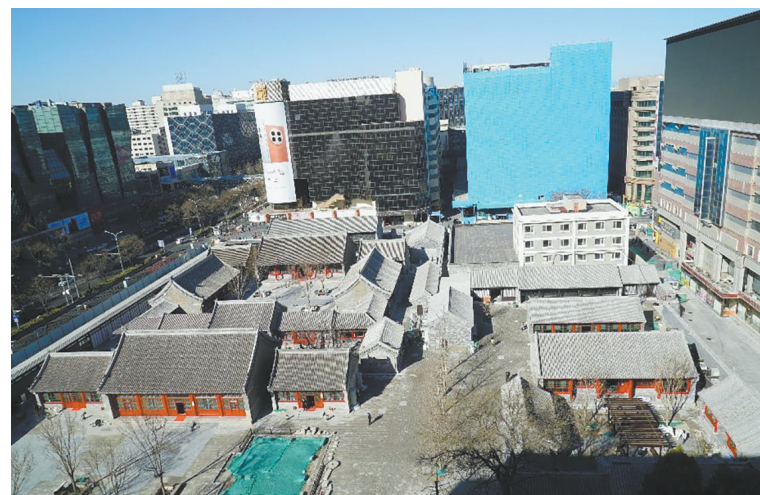
文物建筑群修复后