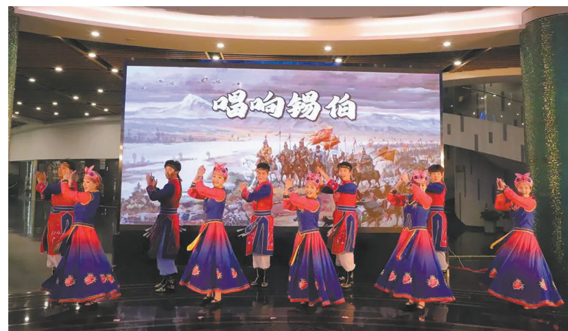
“锡伯赤子的家国情怀”展览配套活动