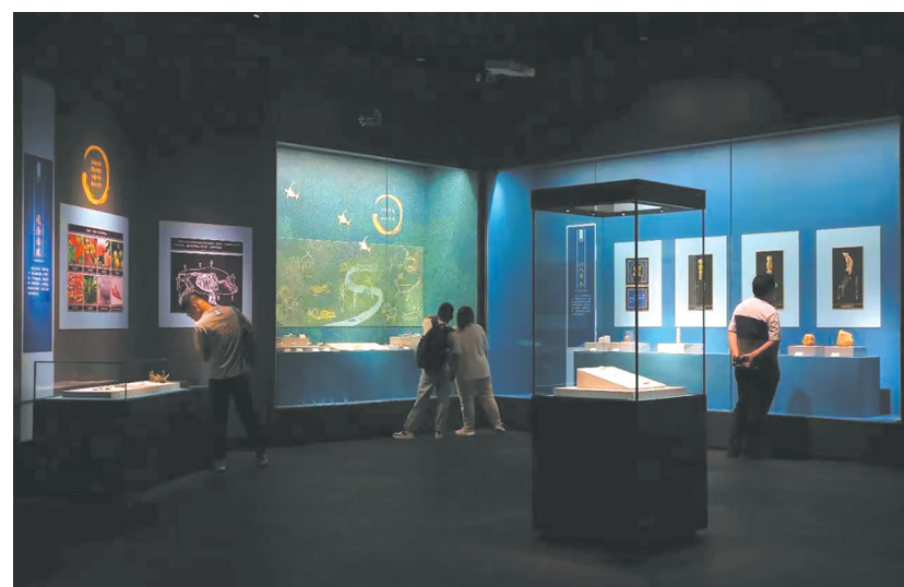
“文明之光——红山·良渚与中华文明”展厅

近日,在2024年文化和自然遗产日主场系列活动沈阳博物馆大放异彩。作为省会城市综合类博物馆,今年5月和6月,该馆连续推出三个展览,紧跟时代精神、把握时代脉搏,积极运用创新成果,充分展示出一个新馆的创意与担当。