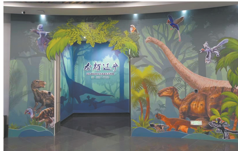
龙耀辽宁——辽宁古生物化石特展

一家新生博物馆,在创新展览展示、推动文物活化利用、推进文明交流互鉴工作上不断探索、锐意进取,在推动社会参与、区域协调、融合发展上担负起新的文化使命,以中华优秀传统文化润泽心灵,不断赓续历史文脉,谱写当代华章。路漫漫其修远兮,沈阳博物馆将一直在路上。