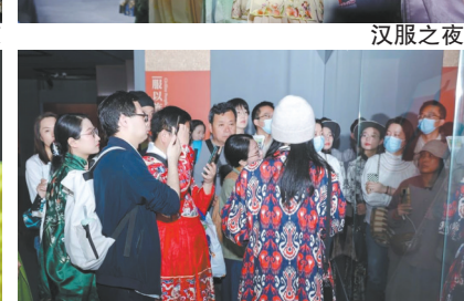
观众参观“孔府旧藏礼乐服饰文物特展”