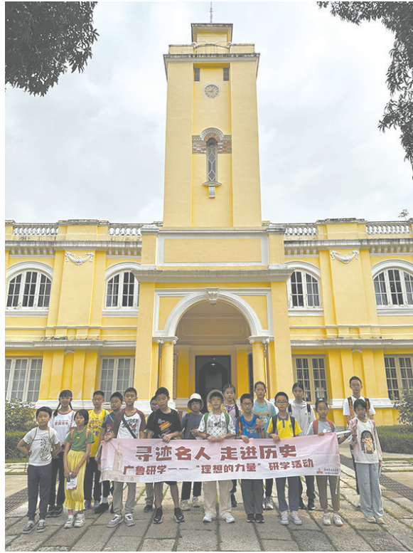
寻迹名人 走进历史——“理想的力量”研学活动