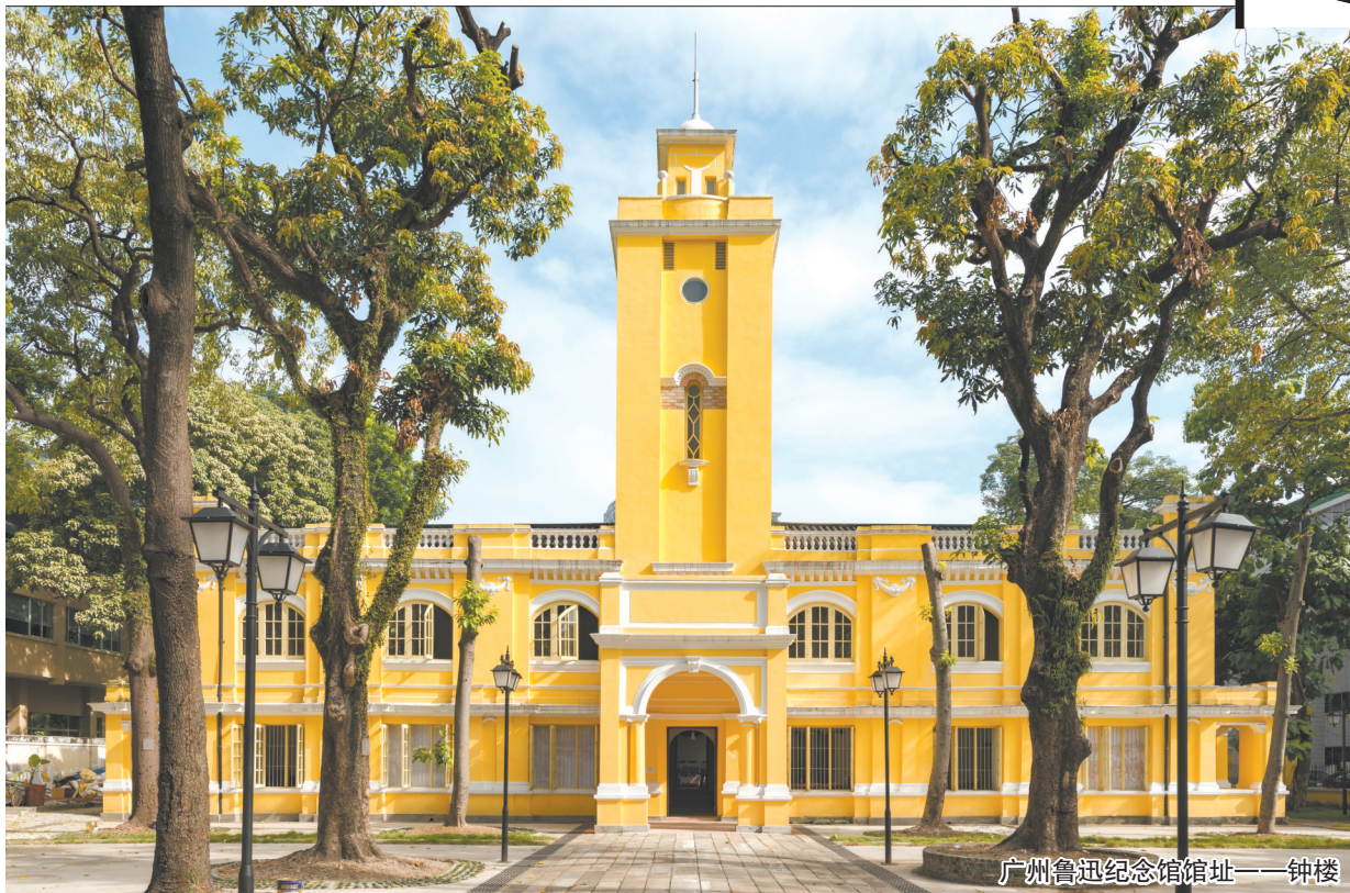
广州鲁迅纪念馆馆址——钟楼

文化遗产是人类社会宝贵的财富。文物生动地叙述着过去,也深刻影响着当下和未来。2024年国际博物馆日主题为“博物馆致力于教育和研究”,强调博物馆在提供全面教育体验方面的重要作用。随着我国人民生活水平的提高和博物馆事业的不断发展,人民大众的精神需求与休闲需求日益增多,博物馆、纪念馆不仅是传播知识、弘扬文化的场所,更成为人们休闲体验的重要场所。广州鲁迅纪念馆隶属于广东省博物馆,所在区域原为清代广东贡院,现管辖全国重点文物保护单位中国国民党一大旧址(钟楼)和广东省文物保护单位广东贡院明远楼(红楼)。它是文学类纪念馆,同时也是人物类纪念馆、革命类纪念馆,在“五个粤博”的引领下,坚持以展览和教育为抓手,以展览带动教育,以教育促进展览,用多样化的文化视角讲好文物文化故事,打造立体多元的公共文化空间,为观众提供多元化的参观体验。