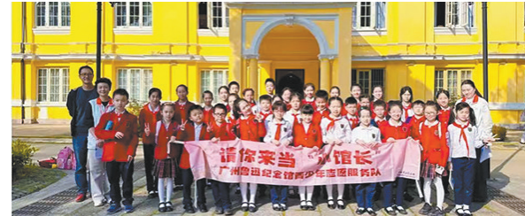
“请你来当小馆长”活动

在文旅融合的新型发展态势下,广州鲁迅纪念馆将继续多措并举,结合文物文化资源,持续提升展览质量,持续打造独具特色的研学活动,持续推动博物馆的融合发展,探索文物文化的展示方式,推动优秀传统文化的传承和发展,讲好文物故事,打造立体、多元、活力的公共文化空间,为打造“五个粤博”立体化建设助力,为广东高质量文化发展赋能。