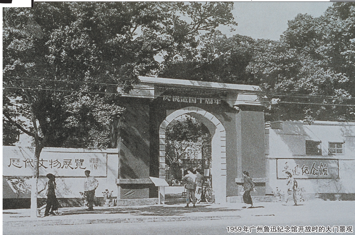
1959年广州鲁迅纪念馆开放时的入门景观