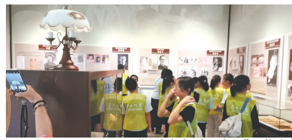
“寻找名人·走近鲁迅”研学活动

探索新型馆校合作机制,共建博物馆青少年教育品牌项目。2023年9月,“请你来当小馆长”活动项目在文德路小学开学典礼上正式启动,目前已开展两期。活动通过“授课—现场体验—培训—实践”等方式进行。在成为“小馆长”的过程中,参与的同学能够感受先辈们吃苦耐劳的奋斗精神,能够忆苦思甜从而珍惜当下来之不易的生活环境,为实现个人梦想、国家梦想而努力,并且还能进一步了解到广东贡院的历史文化。通过让大学生“走进来”等方式,与暨南大学、广州科技职业技术学院签订馆校合作协议,进一步探讨馆校合作事项。与暨南大学、中山大学、湖南大学等学校合作,引导学生参与馆内的讲解等服务,充分发挥以文化人、以文育人的重要作用,真正使纪念馆成为学生们的“第二课堂”。