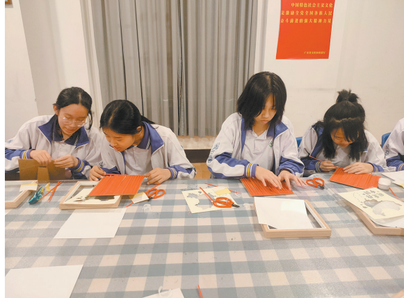
广州市第十六中学参加“理想的力量——竹编手工体验”活动