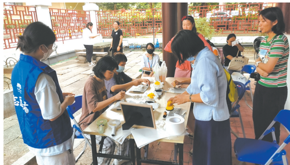
“天开文运”拓印活动