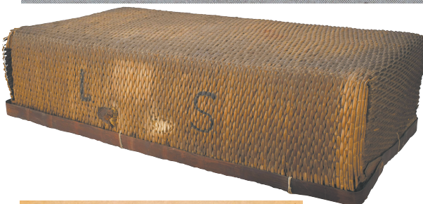
广州鲁迅纪念馆藏鲁迅用过的藤箱,上面有鲁迅亲笔书写的“L.S.”(鲁迅二字的英文缩写)字样