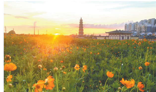
北海市合浦海上丝绸之路文化遗址公园