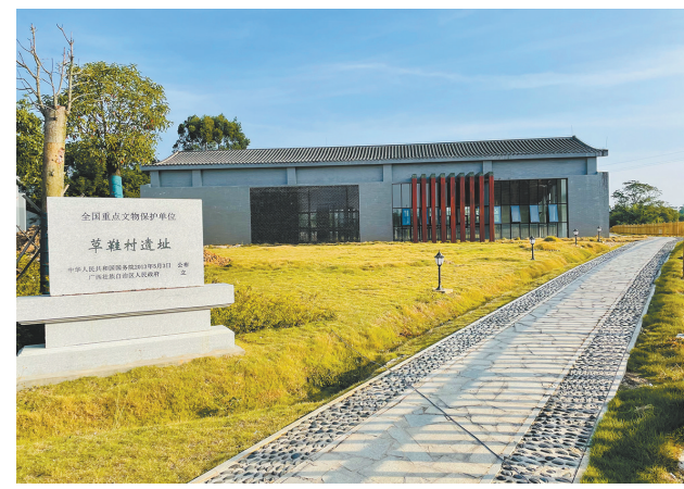
北海市合浦汉墓群文昌塔片区

上丝绸之路这一宝贵的遗产，对于传承世界文明，促进国际经贸文化交流，具有深远的影响。海上丝绸之路联合申遗肩负着新的历史使命和时代意义，任重道远。北海将以海上丝绸之路联合申遗为抓手，与海丝沿线各城市密切合作，加快海丝联合申遗步伐，充分挖掘海丝史迹资源价值，不断探索文物保护传承高质量发展路径，谱写新世纪海上丝绸之路新篇章。