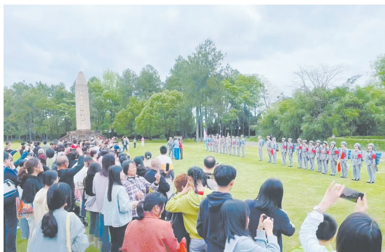
游客体验《十送红军》情景演艺

“五一”假期以来,江西瑞金共和国摇篮旅游区人潮涌动,游客们品尝红井水,游红色旧址,看红色歌舞,参与《追风1932》全景区沉浸式剧本杀、《十送红军》大型情景演艺等各种形式多样的活动,畅享红色之旅的精彩和愉悦,在游览体验活动中追寻红色足迹、传承红色精神。共和国摇篮旅游区继元旦假期火爆开场实现“开门红”之后,又朝“季季红”阔步迈进。据统计,5月1日至3日,瑞金共和国摇篮旅游区客流量23.73万人次,同比增长183%,一季度共接待游客133.39万人次,同比增长165%。各级媒体纷纷宣传报道,引起广泛关注。