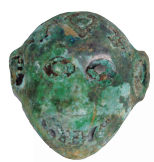
赫章可乐M373出土铜面具扣