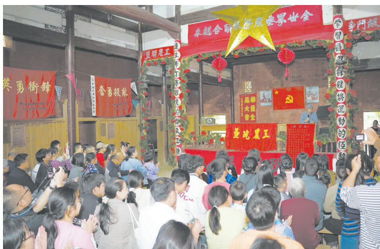
游客参与《一苏大选举》互动演艺