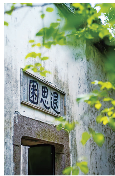
丽则女学旧址(左)、同里古镇(中)、退思园(右)

江苏省苏州市同里古镇地处太湖下游的湖荡平原,京杭大运河东畔。“醇正水乡,旧时江南”,同里古镇有着丰富的历史文化遗产,拥有世界文化遗产地1处、各级文物保护单位115处,是江苏省唯一一个整体被列为省级文物保护单位的古镇。