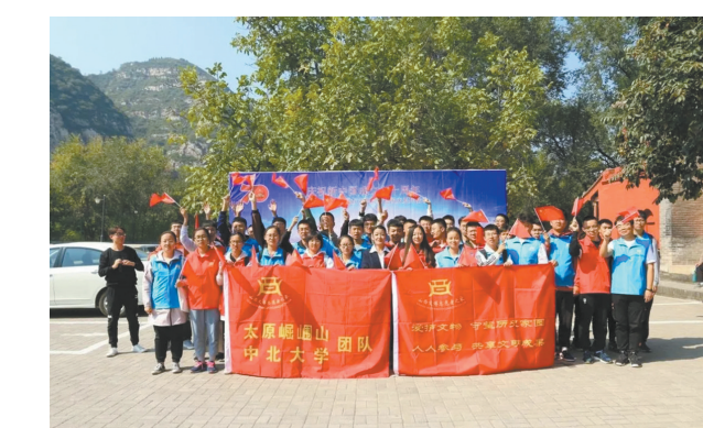
太原崛围山中北大学文博志愿者团队

团队从长远发展角度出发，协调中北大学，将文博志愿服务纳入创新与素质拓展学分激励制度，通过拓展常态化活动，进一步增强大学生参与志愿服务的积极性和主动性，促进了团队的健康可持续发展。