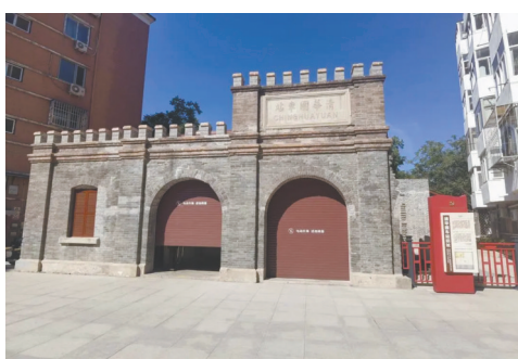
清华园车站旧址修缮后正立面