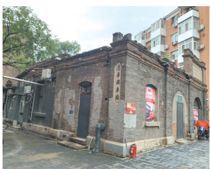
清华园车站旧址南立面修缮前