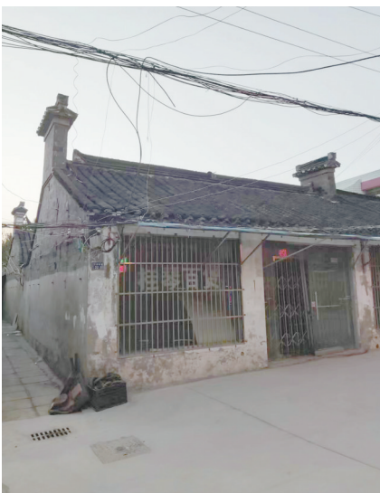
苏利巷街区马头墙