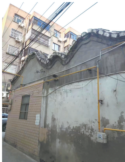
苏利巷街区勾连搭顶

江苏省泰兴市地处长江中下游地区，南宋绍兴初年泰兴县治迁至现泰兴延令街道所在地，围筑土城，形成瓜形县城，苏利巷地块即在泰兴瓜城内。苏利巷街区现占地1.74万平方米，南至国庆路，西至南草巷，北到银铤巷，东到三井南巷，一条苏利巷从中横贯东西。苏利巷街区是目前泰兴老城区唯一仅存的传统街区，曾是泰兴县城历史上名门望族的聚集地。街区内除有3处文保单位外，还有大量体现地域文化特色的清代、民国时期的古民居以及一批具有历史价值的构筑物和古树名木等。街区整体保留了苏中地区民居的传统格局和历史风貌，集萃人文，承载记忆，寄托乡愁，是泰兴宝贵的文化遗产和精神财富。