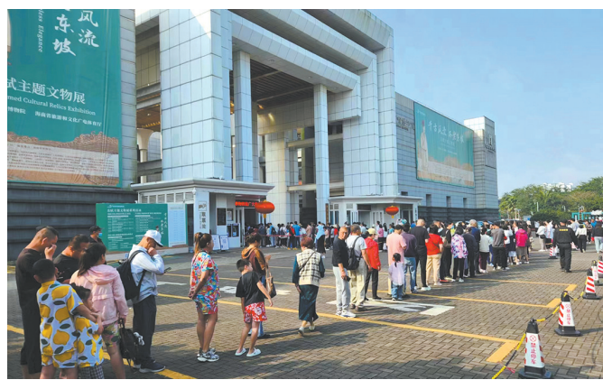
观众有序排队入馆