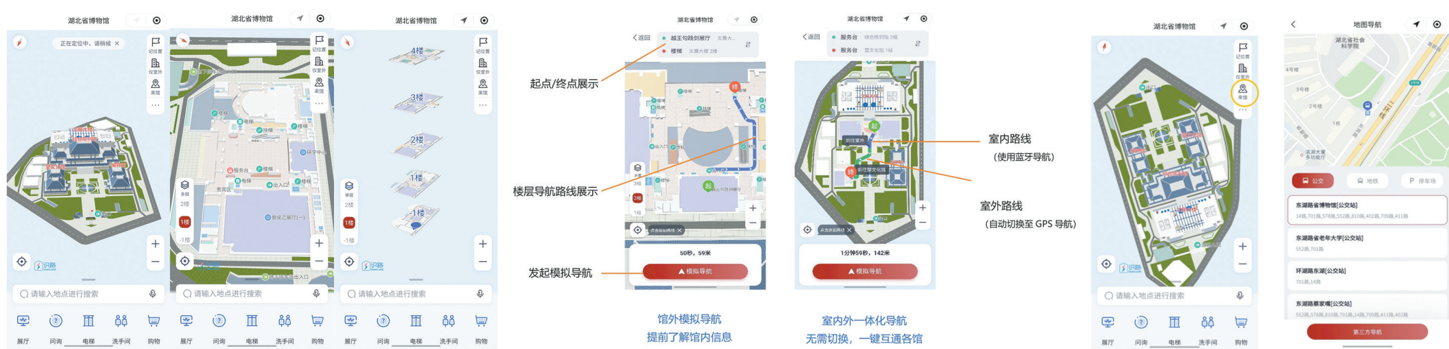
图1 可视化地图手机端界面

可视化导航系统应用主要包括云服务器、管理后台、移动设备(用户终端)和蓝牙信标四大部分,使用蓝牙信标技术和多源融合定位算法,将不同场景的数据融合在一套定位算法中且支持