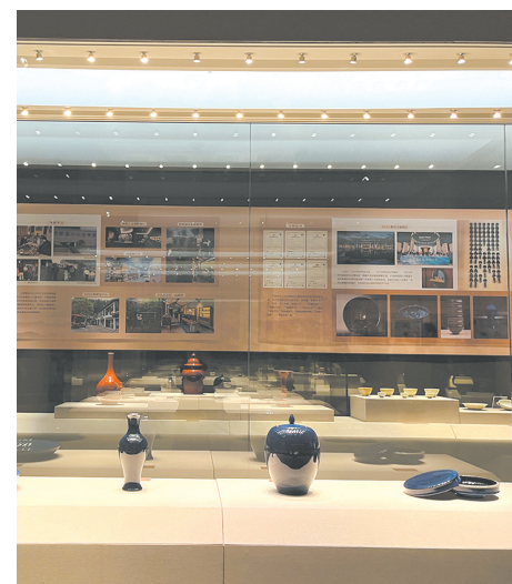
“天目产佳瓷——天目窑文物专题展”第五篇章“窑火传千年”展厅

关的“窑厂边、瓷界头、碗窑坞”等地名,以及满山遍野遗落的瓷片、窑渣、窑具等,仿佛都在叙述着一个远古的神话。