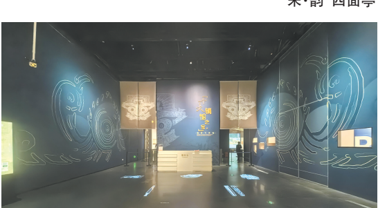
“十大镇馆之宝——浙江人文探索馆体验展”序厅