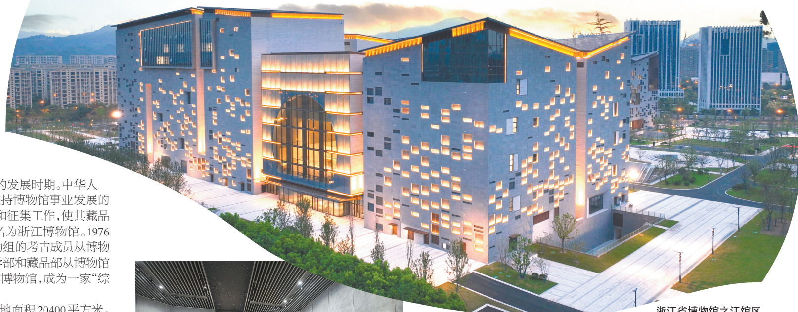
浙江省博物馆之江馆区