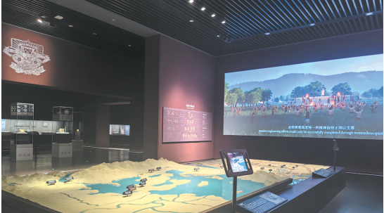
“浙江一万年：浙江历史文化陈列”五千年良渚，文明璀璨展厅