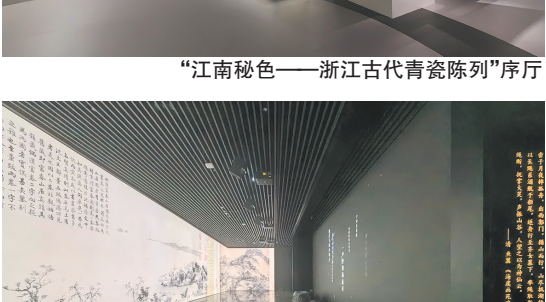
“山水之间——《富春山居图》人文数字陈列”沉浸式影院