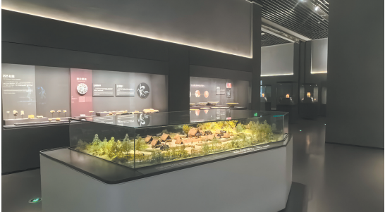
“浙江一万年：浙江历史文化陈列”一万年上山，稻作起源展厅