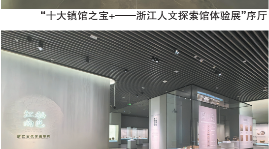
“江南秘色——浙江古代青瓷陈列”序厅