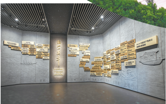
“浙江一万年：浙江历史文化陈列”序厅“百件大事记”