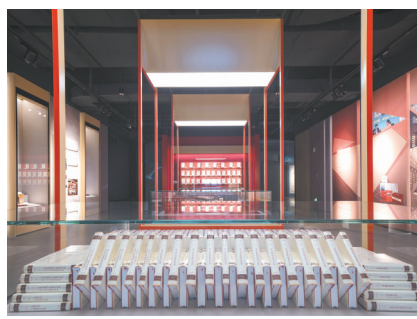
中华书局图书馆旧藏