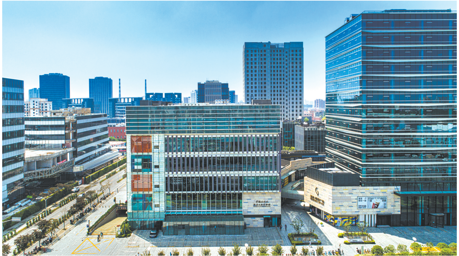
中国近现代新闻出版博物馆