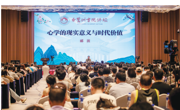
郦波教授做客白鹭洲书院讲坛