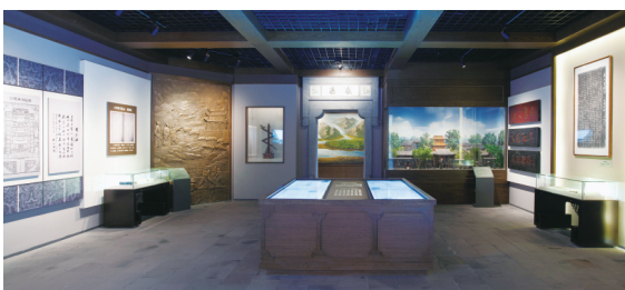
白鹭洲书院文化展览内景