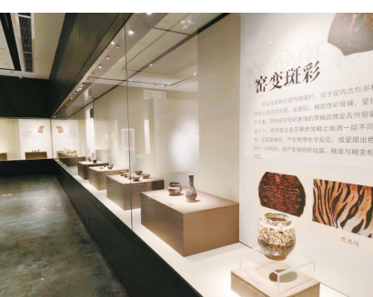
“吉州窑精品文物展”在重庆市忠州博物馆展出