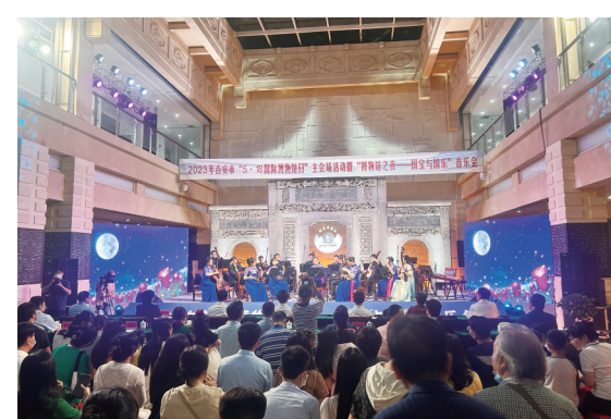
2023年国际博物馆日“博物馆之夜”活动