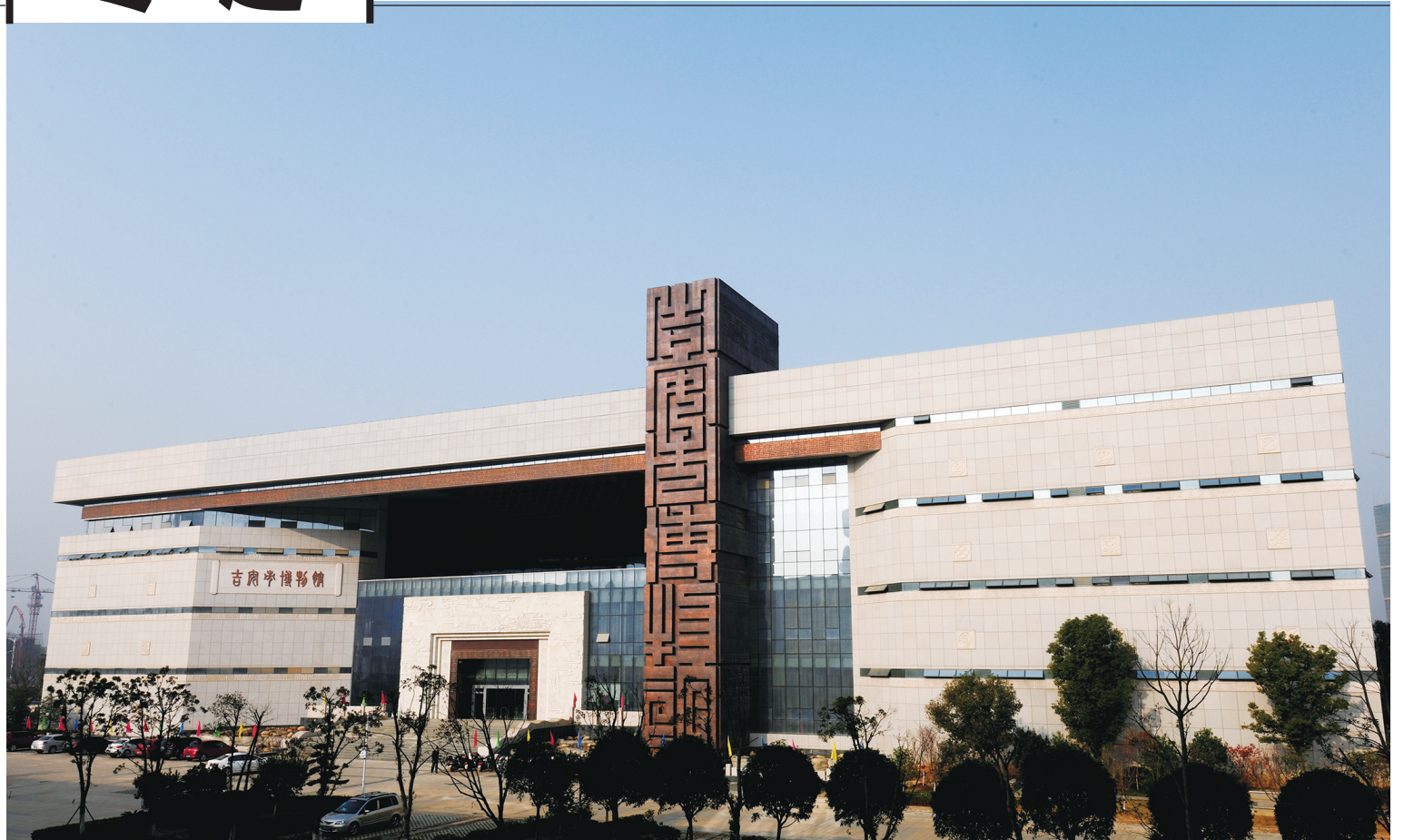
吉安市博物馆外景

近年来，吉安市博物馆铆足干劲，扬长补短，开拓进取，在强力推进馆藏文物数字化保护利用的同时，抓住馆藏特色文物和优质文化资源，开展了一系列卓有成效的展示教育活动，“吉州窑文物精品展”在8省12市(县)开展巡展，白鹭洲书院讲坛在省内外影响巨大，共策划、引进临时展览23场次，开展社教及研学活动225场次，共接待游客239.66万人次，吉安市博物馆的社会影响力持续升温，社会教育功能有力彰显。2020至2021年连续两年获得江西“全省博物馆免费开放绩效评估”优秀等级，2022年度获得“全省博物馆纪念馆公共服务考核评价”优秀等级。