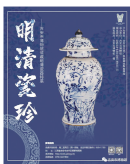
“明清瓷珍——吉安市博物馆馆藏明清瓷器特展”海报