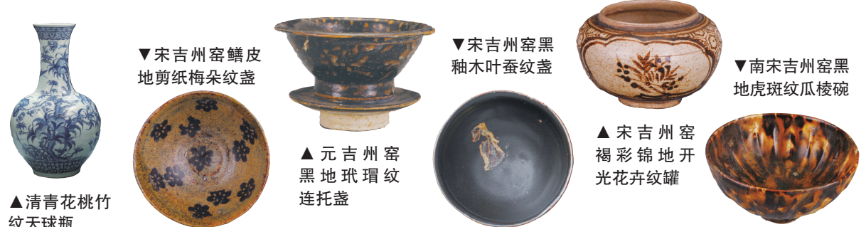
▲青花桃竹纹天球瓶

数往知来，吉安市博物馆将继续加强文物保护和研究阐释，遵循陈列展览工作客观规律，以观众为本，多措并举，提供更多优质展览和服务，不断满足群众对美好生活的向往和需求。