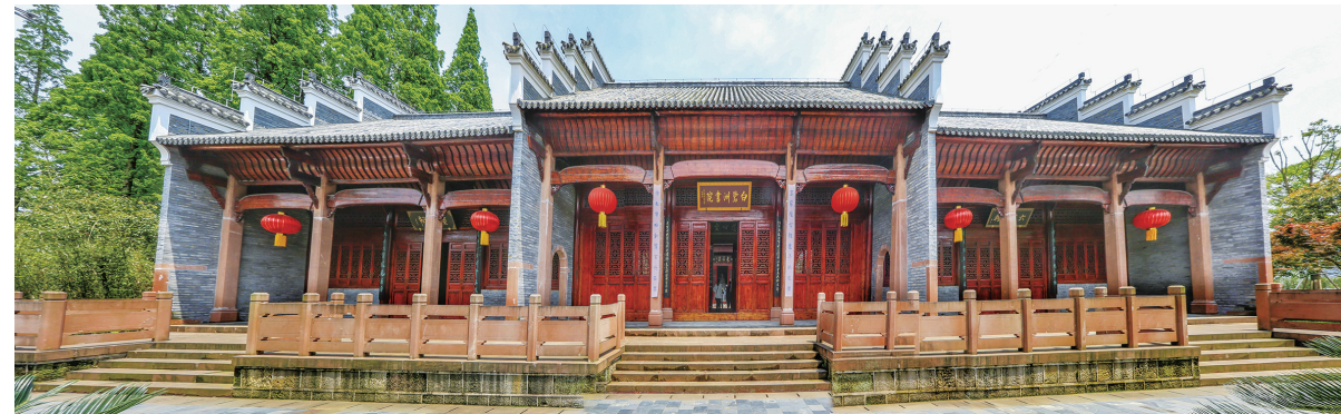
修缮后的白鹭洲书院