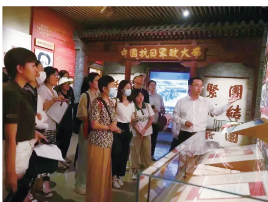
伟大工程——抗战时期中国共产党的建设专题展开幕

2015年推出的“伟大胜利 历史贡献——纪念中国人民抗日战争暨世界反法西斯战争胜利70周年主题展览”，以2800余件文物、1170多张照片和若干艺术品生动展现了中国共产党在抗