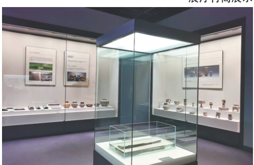
展厅陶器组合展示

解该遗址的学术价值。老河口柴店岗遗址出土与鄧侯相关的封泥展示区,辅以萧何的介绍及鄧侯世系表等。