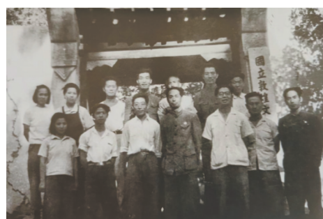
国立敦煌文物研究所职工合影

员优质高效地完成了任务,为莫高窟益寿延年做出了贡献。进入新时代,传统技艺和现代科技并驾齐驱,为敦煌石窟保护利用保驾护航,文物保护精雕细琢、数字展示精益求精,敦煌研究院涌现出了“大国工匠”和国家卓越工程师团队,敦煌壁画修复技术在第二届国家技能大赛上入选“最受欢迎十大绝技”。不同历史时期的“敦煌工匠”以爱岗敬业、争创一流,艰苦奋斗、勇于创新,淡泊名利、甘于奉献的工匠精神,奠定了敦煌文化成为世界文明长河中璀璨明珠的坚实基础。