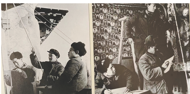
20世纪60年代莫高窟测绘和壁画临摹现场