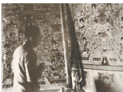
20世纪50年代常书鸿在莫高窟临摹壁画