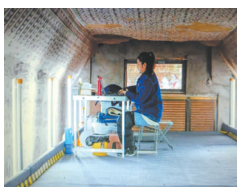
莫高窟壁画数字化采集现场

煌文化使当地观众倍感亲切;在东欧社会主义国家,专家学者认为敦煌壁画艺术形式相较于欧洲中世纪宗教壁画更为开放包容、更接地气,普通观众则建议纺织工业部门负责人借鉴来自古老东方的敦煌艺术元素改进产品设计。可以说,敦煌文化的早期对外交流已经初具“一带一路”民心相通雏形。进入新时代,随着共建“一带一路”的走深走实,敦煌文化在服务国家战略、弘扬丝路精神方面的重要性日益凸显。敦煌研究院连续多年跻身全国博物馆海外综合影响力TOP10榜单前五之列,其主办或承办的敦煌学国际学术研讨会及文化遗产领域国际论坛增多了中国在各相关领域话语权和影响力;敦煌文物外展及学术交流活动和敦煌研究院引进的国外优秀文物展览促进了文明交流互鉴;敦煌文化成为历届敦煌文博会的永恒主题和展论活动重头戏。实践证明,莫高精神亦是丝路精神的生动写照。