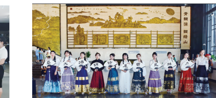
开展“汉服同袍游”活动