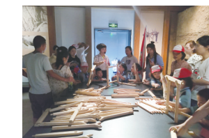
模拟井巷支护搭建亲子体验活动