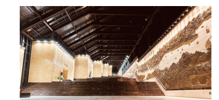
铜绿山古铜矿遗址博物馆新馆

天地一洪炉，举世无双冶。滚滚长江，奔流千万里，把最神奇的55平方公里的铜绿山留给了大冶；泱泱华夏，上下五千年，把最传奇的4000年冶炼史留在了大冶。