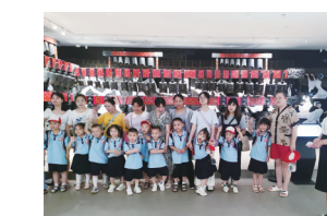
开展“快乐亲子游”活动