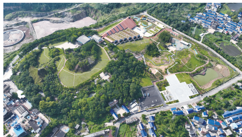
铜绿山古铜矿遗址保护区