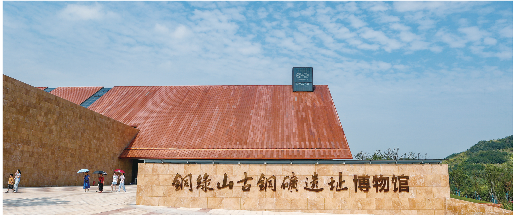
铜绿山古铜矿遗址博物馆新馆