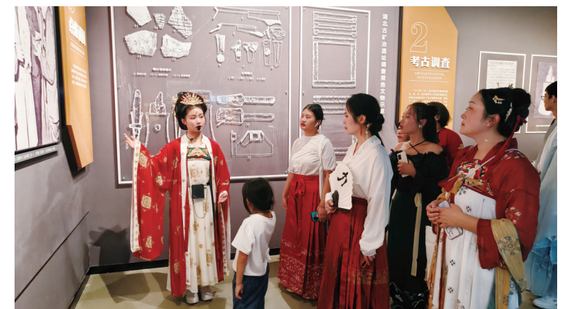
开展“七夕奇妙游”活动