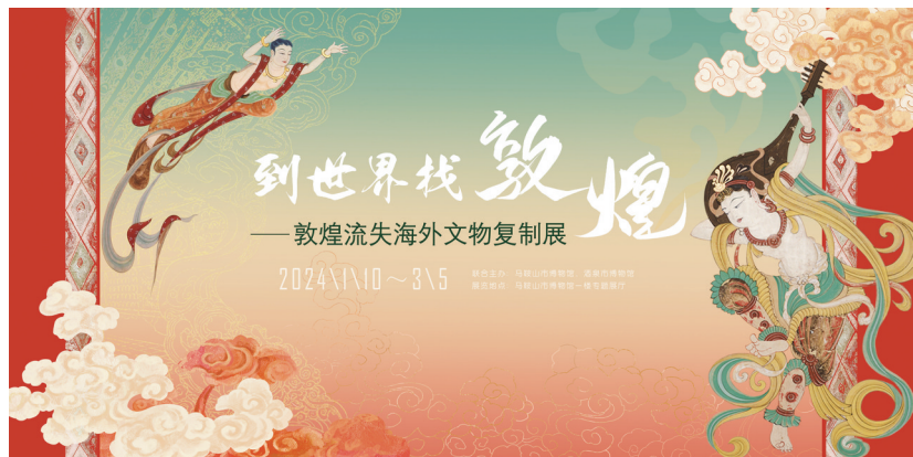
到世界找敦煌——敦煌流失海外文物复制展

宁夏回族自治区各博物馆充分挖掘阐释文物内涵，策划推出以春节文化为主题的系列展览、丰富多彩的传统民俗体验和社教研学活动，营造浓郁热烈的节日氛围，丰富春节期间人民群众文化生活。“博物馆里过大年”活动可以将传统文化与现代生活相结合，让人们在享受节日氛围的同时，也能接受到文化的熏陶和教育。