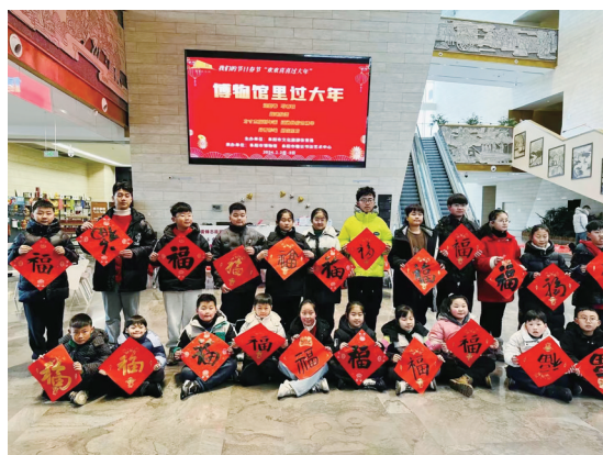
“迎新春 送春联”活动