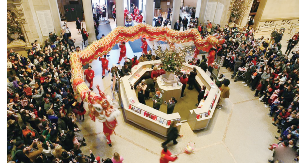
2月3日，在美国纽约大都会艺术博物馆，参观者观看舞龙表演

年画”，博物馆手工坊教室门前排起长队。国家级非物质文化遗产传承人向参加活动的家长和小朋友们讲述雕版印刷的历史，亲手演示、互动教学，涂墨、刷匀、印制，一幅幅精美画作诞生。