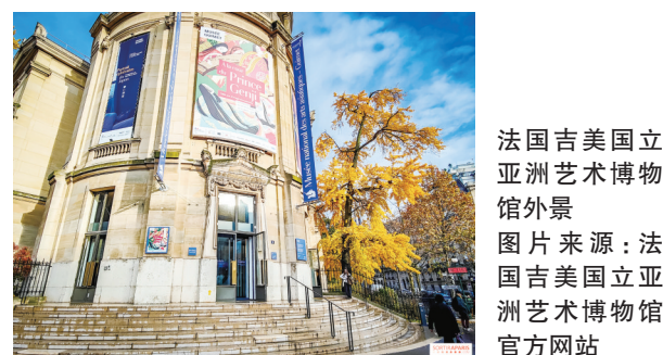
法国吉美国立亚洲艺术博物馆外景

如今，博物馆是中国文化出海的重要组成部分，逐渐成为海外年轻人了解中华文化、聆听中国故事的重要载体。未来，更加丰富的中国文物元素将满载更多创新表达，借更多传播载体“出海”，持续“圈粉”海外受众。(半福婧)