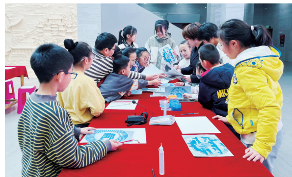
中卫市博物馆文博课堂“多彩沙画绘文物”

春节是中华民族最隆重的传统佳节，是百节年为首、四季春为先的重要时刻，更是中华优秀传统文化的集中体现。在龙年春节即将到来之际，宁夏回族自治区各博物馆为公众准备了汇集中华优秀传统文化、革命文化、社会主义先进文化的特色展览、民俗体验、非遗展示、文创市集、研学教育等127项系列活动，致力于让公众通过博物馆感知文物中蕴藏的丰富内涵和中华优秀传统文化的浓厚气息，让博物馆里过大年成为新年俗。