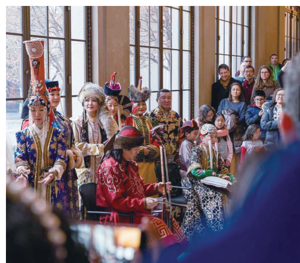
美国国立亚洲艺术博物馆新年活动现场