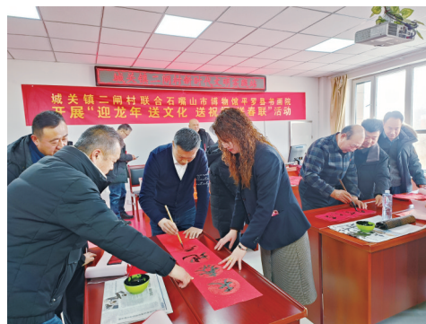
石嘴山市博物馆“迎龙年 送文化 送祝福 送春联”活动