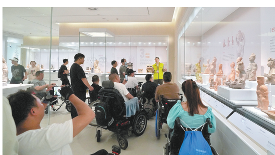
博@暖心志愿服务项目

展览遍渝州是三峡博物馆社会教育品牌的重要组成部分,自2010年起,全市范围的巡展达5772场次,惠及区县人民达600万人次。而巡展志愿者们从项目运行开始,便参与其中,他们跋山涉水,与博物馆工作人员一起将优秀展览与教育活动带到偏远山区,包括重庆曾经的18个深度贫困村和现在的17个乡村振兴乡镇,让村镇群众与城市居民能够共享公共文化资源。