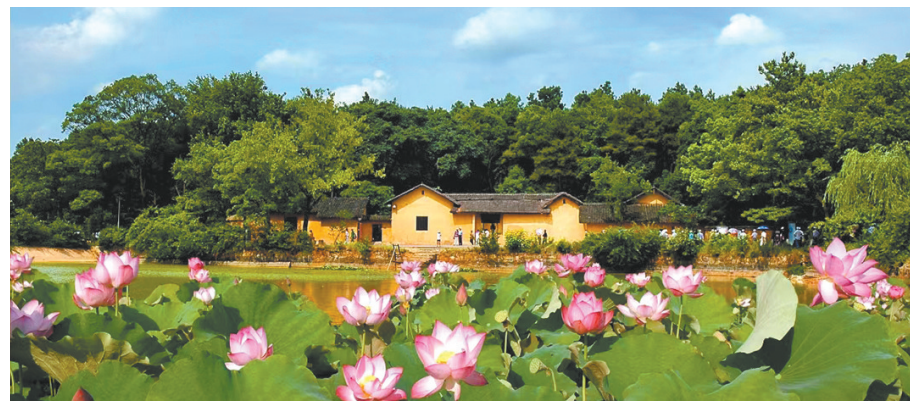
四季炭子冲——夏