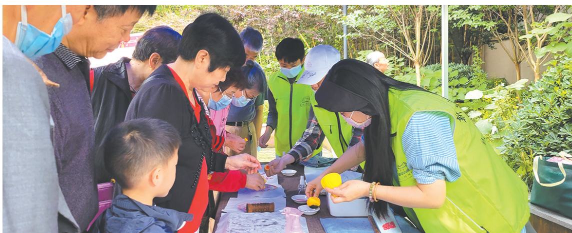
志愿者服务“展览遍渝州”巡展

“守正创新”是重博志愿者队伍发展进化的精神内核。三峡博物馆在坚守传统的“人传人”线下服务阵地同时,注入“用户画像”等互联网思维,培养“以普通民众为基础”的专业志愿队伍,改革创新探索多样、均等、全覆盖的志愿服务模型,努力让更多人通过志愿服务的桥梁,找到自身在文化传承中的主体地位,自发成为“全社会参与型”文物事业的“合伙人”。