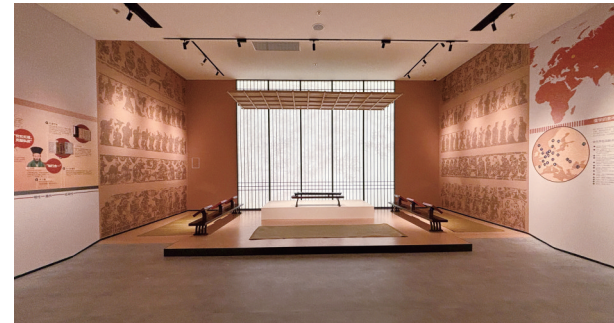
第三单元互动场景

春秋战国时期,急剧动荡的社会变革,从根本上冲击了原有的社会秩序,激发了思想家们面对的各种现实问题的讨论,促生了百家争鸣。秦王朝强权政治导致的后果,促使汉王朝的统治者进行深刻反思,调整国家管理思路,推崇儒学,使之成为推行教化的思想工具。汉武帝时期,“独尊儒术”成为集权国家的统治思想。太学兴起,经学普及,广开学路推动文化传播,更使儒家思想根植于民心,儒家政治的发展与确立,使儒家“入世”成为必然。