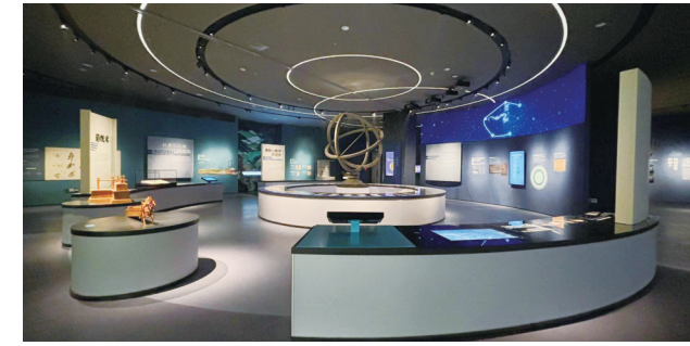
多媒体装置:中国机括

第五单元:多媒体装置“中国机括”为观众解读了“一天下”制度的设计下,没有动员不到的力量,也没有到达不了的地方。中华文明以强大的科技实力,造就了早期世界文明发展的齿啮涡轮。路通八方、纸书万国、星数导航,纵观自然,以举目的创造力和创新力,开拓了人类文明史上第一次全球意义的大交流。