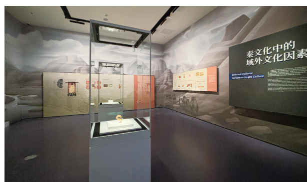
第六单元“互鉴——中国对世界的探知”展览现场

国运昌盛,经济繁荣,秦汉王朝与域外世界逐渐展开了大规模、全方位的交流与互动,从草原丝路、陆上丝路到海上丝路,域外多彩的世界进入了中国的视野,中国多姿的生活也吸引着域外人口的迁入。古代中国认识世界的新格局打开了。自此,开放、包容的中华文明,始终与其他文明交流互鉴、和合融通,保持着旺盛的生命力。第六单元重点展示西安市汉长安城北渭桥遗址出土的古船,船体各部分用不同形式的榫卯连接,其中相邻两列船板先用长方形内嵌式榫板拼接,再以圆形木钉贯穿船板与榫板,榫板斜向成列。这种大量使用木榫板、木钉并联合船板的技术,在我国尚属首次发现,而在罗马时期的地中海区域曾被广泛使用。这条古船的出土,填补了汉代船舶发现的空白;同时,这种时代相近、距离较远的两个地点使用相同技术的现象,也是“丝绸之路”文化交流的象征。