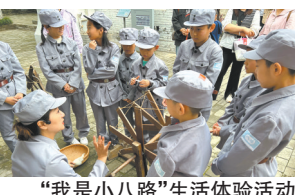
“我是小八路”生活体验活动