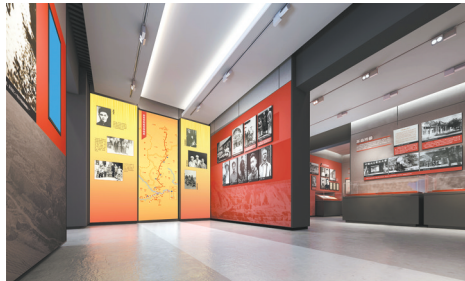
基本陈列“八路军驻陕办事处史实展”