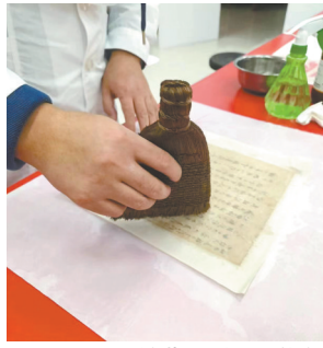
馆藏纸质文物修复