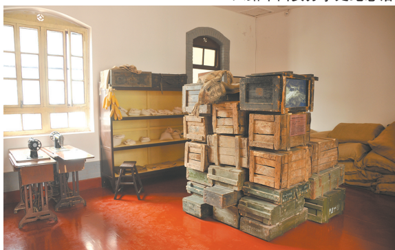
四号院采办委员会暨经理科旧址