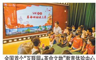
全国首个“互联网+革命文物”教育体验中心

走出去，开展“理想信念”主题宣讲。 “理想信念”宣讲小分队自2012年成立以来，始终不忘履行社会义务，主动深入机关事业单位、农村、社区、企业、学校、部队等开展宣讲，截至目前共宣讲1000余次，听众达20万人次，获得社会各界广泛好评。今年，西安八办结合国家颁发的学科课程标准，对标小学、初中阶段知识点，以VR、交互、多媒体等技术为载体，开发4节“流动博物馆”社教课程，创新红色文化教育模式。