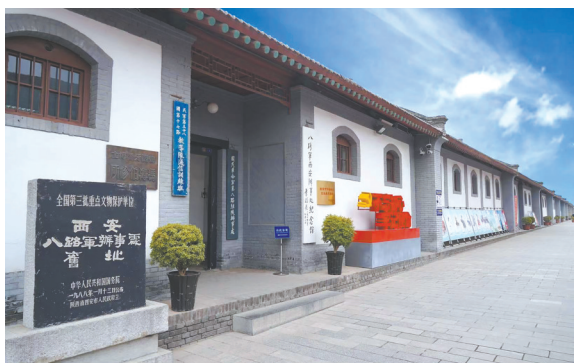
八路军西安办事处纪念馆

启用馆标。 2023年8月11日，西安八办正式启用馆标，LOGO以简洁的线条勾勒出七贤庄庄首，给观者以庄严、稳重的视觉体验。作为西安八办对外的唯一形象标识，将广泛应用于导视系统、办公用品、宣教系统等多种具体场景。七贤庄作为西安城内一道独特的亮丽风景，再次焕发青春活力，成为西安八办对外交流宣传的名片。