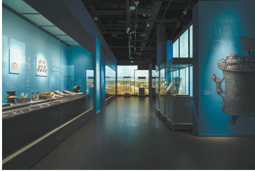
大幅灯箱还原自然地貌与文物结合展示