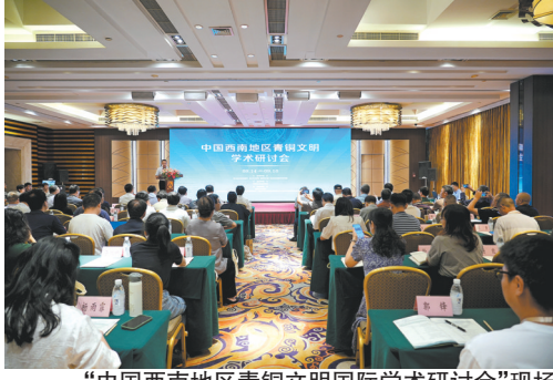
“中国西南地区青铜文明国际学术研讨会”现场

面向专家学者,精心策划“中国西南地区青铜文明国际学术研讨会”,吸引海内外50余家文