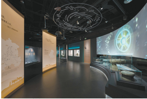
铜鼓与巨幅投影、石雕共同打造的沉浸式场景