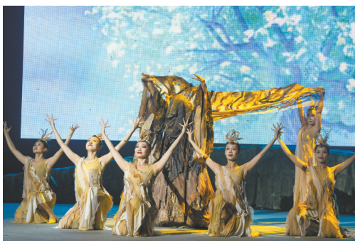
“金沙之夜”主题音乐会”现场