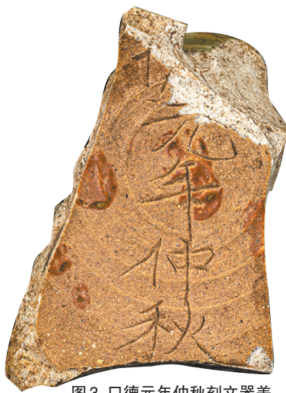
图3 口德元年仲秋刻文器盖