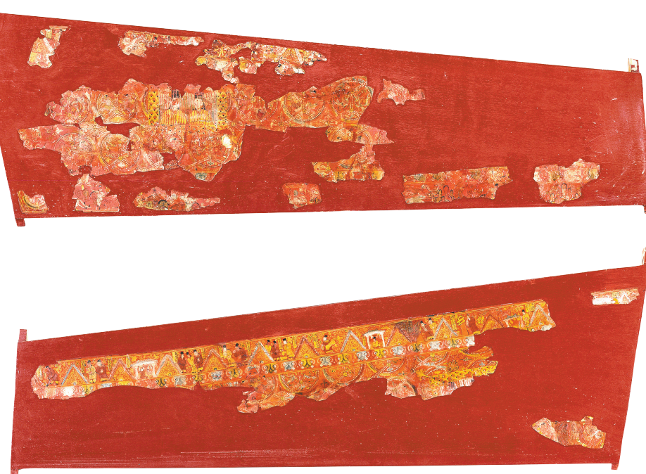
图4 固原北魏漆棺画一组