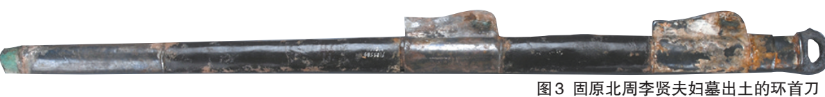
图3 固原北周李贤夫妇墓出土的环首刀