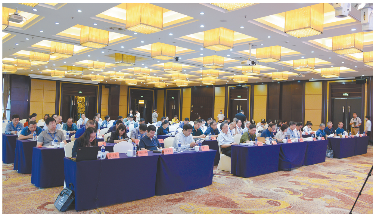
“丝绸之路暨北朝时期固原区域文化”国际学术研讨会与会嘉宾、学者

魏晋南北朝是继春秋战国之后我国历史上第二次民族大融合时期，各民族文化呈现整合趋势，社会也逐步走向统一。本次学术研讨会的参会学者从多方面对北朝时期的政治、军事、文化进行了探讨。华东师范大学历史学院教授章义和以《黄老道〈景图真经〉、新天师道与北魏国家的转型》为题，探讨了北魏国家的华夏转型是黄老政治的延续，新天师道得以参与北魏国家转型过程，依托政治力量推行全国。陕西师范大学历史学院教授黄寿成以高演、高湛“兄弟弑及”中的领军将领为例，阐释了东魏北齐时期在政变中领军将领并没有起到很大作用，相反一些在政权中的显赫地位家族起到了关键作用，决定了当时的政治局势取向。武汉大学历史学院副教授姜望来以《魏晋到唐初：皇位传承与中古时代特质》为题，讨论了皇位传承问题，进行宏观审视和把握，对相关历史进程予以辩证思考和分析。他认为在魏晋至唐初期间，皇位传承受到一些在汉以前和唐以后都不存在或至少不典型的特殊因素（中古门阀统治、胡汉不同传统）的影响和制约，从而具有一定的历史独特风格，并在此过程中参与塑造中古时代特殊性质，成为中古时代特殊性质的一部分。北京师范大学历史学院教授严耀中通过梳理北魏在不同时空设置的多个平原郡、关于平原镇、匈奴族与平原郡的特殊关系、地方行政单位变迁中“汉化”因素、导致北魏平原郡情况复杂多变的主要因素等几个方面的问题，论述了北魏平原郡的设置和面貌，进一步阐述了平原郡的特殊性和由此产生的一系列问题。华东师范大学历史系教授李磊以《高平与南京、后秦、西秦、赫连夏的连环盛衰》为研究对象，探讨了西北地缘政治的终结，缘于赫连夏败于北魏。北方民族大学西北民族社会发展研究中心教授张多勇对宇文泰在关陇一带活动涉及的诸多地名进行了定位研究，通过地图空间展示宇文泰等控制的战略要地，揭示了这些军事要塞相互声援，形成防守体系，对于中国古代军事史的研究具有重要作用。西北民族大学历史文化学院教授朱悦梅对文献所见两汉魏晋时期以金城郡内部的县及区划为节点的交通路线进行梳理，以观察汉晋金城郡内部交通及其与周边区域间交通的地理空间分布，进一步研究金城郡交通地理格局的特征及其演变。南京大学历史学院教授张雪峰介绍了南京大学北园东晋墓出土的“金式金属带具”及相关衣物，认为这些文物是研究魏晋南北朝帝陵不可回避的资料；金属带具的源头是草原文化，草原文化因素在吸纳中原文明的理念后，其形制、材料、装饰纹样及思想内涵都发生了重要变化；“晋式金属带具”作为草原文化的完成形态，成为中原文明的象征，随着文明的交流，影响到中国遥远的南方地区及朝鲜半岛、日本半岛等周边地区。宁夏社会科学院教授薛正昌从丝绸之路与固原、北朝地方政权建制、宇文泰经营原州几个方面全方位论述了丝路视域下北朝固原政治、军事与文化，说明原州城不仅是军事重镇，也是丝绸之路西出北上的重要驿站，承载着东西文化交流与商贸往来的重任，尤其是中西文化交往交流与交融。宁夏文物保护中心二级研究员马建军从考古学角度，以近年来宁夏境内丝路考古获得的重要成果，发现的大量丝路文物开始讨论，阐述了丝绸之路宁夏段的文化交流民族融合。固原市地方志研究室主任、一级调研员张志海通过北朝时期的固原基本情况、关陇集团的形成、北朝时期的固原经济社会、北朝时期固原文化艺术几个方面的论述，较完整地厘清北朝时期固原历史发展的脉络，全方位展现了北朝时期固原政治、经济、社会、文化各方面的历史风貌，对进一步研究固原北朝历史文化具有指导意义。