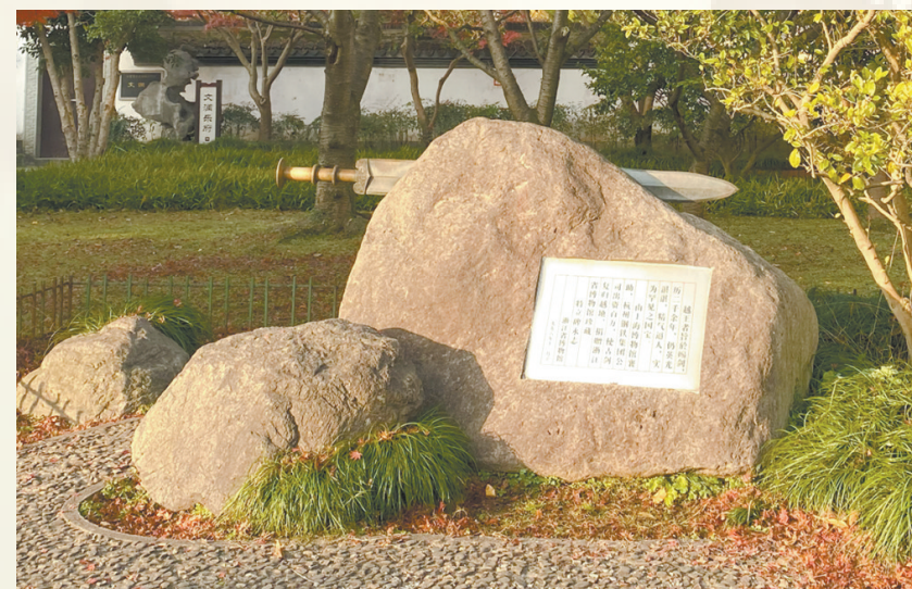
越王者旨於賜剑纪念碑