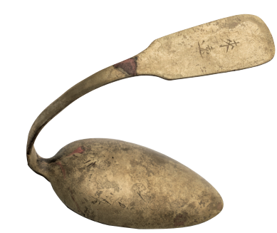
篆刻“来远”的镀银汤勺

了我国水下考古发掘技术水平。沉船、船货以及船上生活、航海相关文物的发现,对深入研究元代航海史、造船史和船上生活等具有重要价值。圣杯屿沉船重现了元代晚期龙泉青瓷外销和海上丝绸之路的繁荣,是近几年我国海上丝绸之路考古的重要成果。