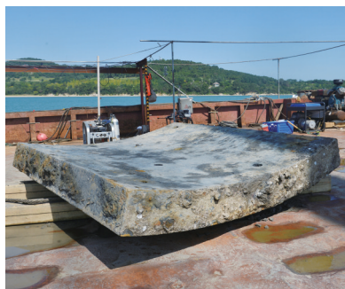
定远舰铁甲板近照