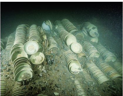
船舱内码放的瓷器