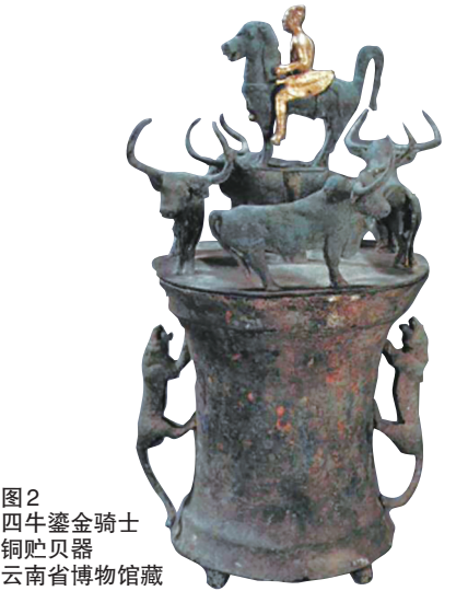
图2 四牛鎏金骑士铜贮贝器 云南省博物馆藏