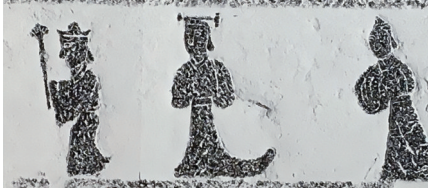
图2 出行画像石，1973年河南南阳唐河电厂汉墓出土，南阳汉画馆藏