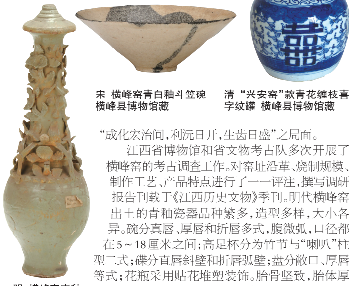
宋 横峰窑青白釉斗笠碗 横峰县博物馆藏 清“兴安窑”款青花缠枝喜字纹罐 横峰县博物馆藏

明代横峰窑 明代横峰窑，是一个规划较大的窑址群系，位于横峰县县城所在地。由岑山西南走向依山而建，起伏绵延。