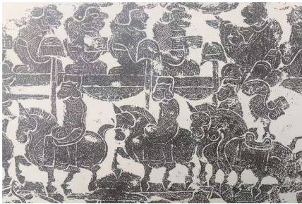
图1 讲经人物车骑出行画像石，1958年山东滕州市桑村镇西户村出土，滕州市博物馆藏

《说文》：“旄，幢也。”清段玉裁注：“以犛牛尾注旗杆，故谓之旄。”《说文》：“犛，西南夷长髦牛也。”