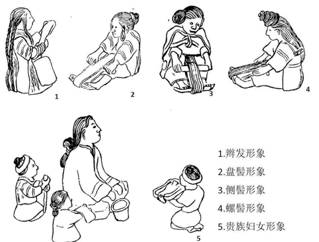
图4 妇女形象图

其一，发饰与从事的职业属性具有一定的相关性。整体上看，青铜贮贝器上的妇女形象多样，但基本可以肯定，雕塑中描述的贵族妇女来自滇族。