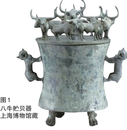
图1 八牛贮贝器 上海博物馆藏