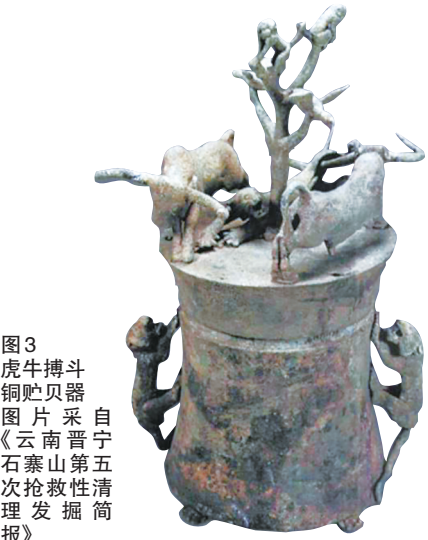
图3 虎牛搏斗铜贮贝器 图片采自《云南晋宁石寨山第五次抢救性清理发掘简报》