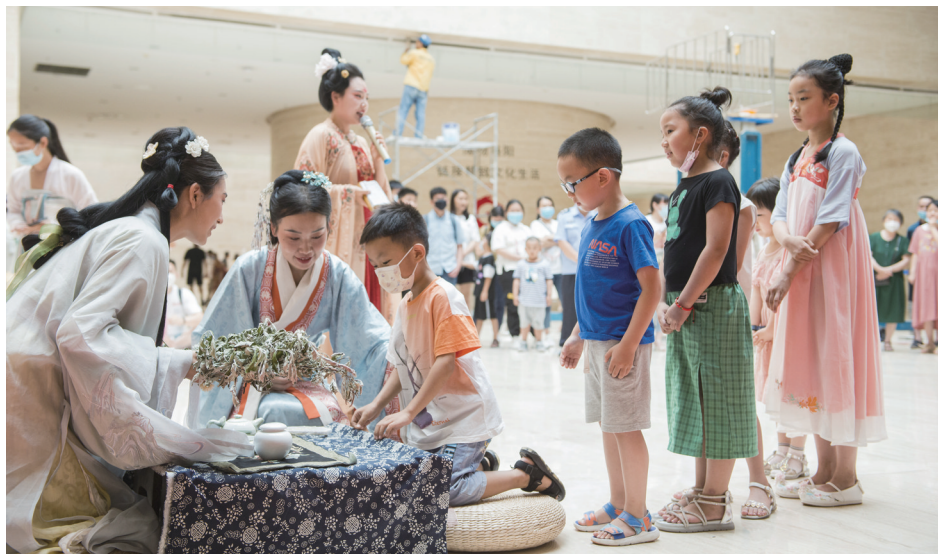
端午节主题社教活动

加强馆校合作,打造研学进校园品牌。在馆校共建方面,2021年起洛博持续打造“做大学校 讲好故事”研学进校园品牌,通过“历史小课堂”形式,将历史文化和文物保护知识带进校园,促进博物馆与学校教育之间有效连接和高质量发展。